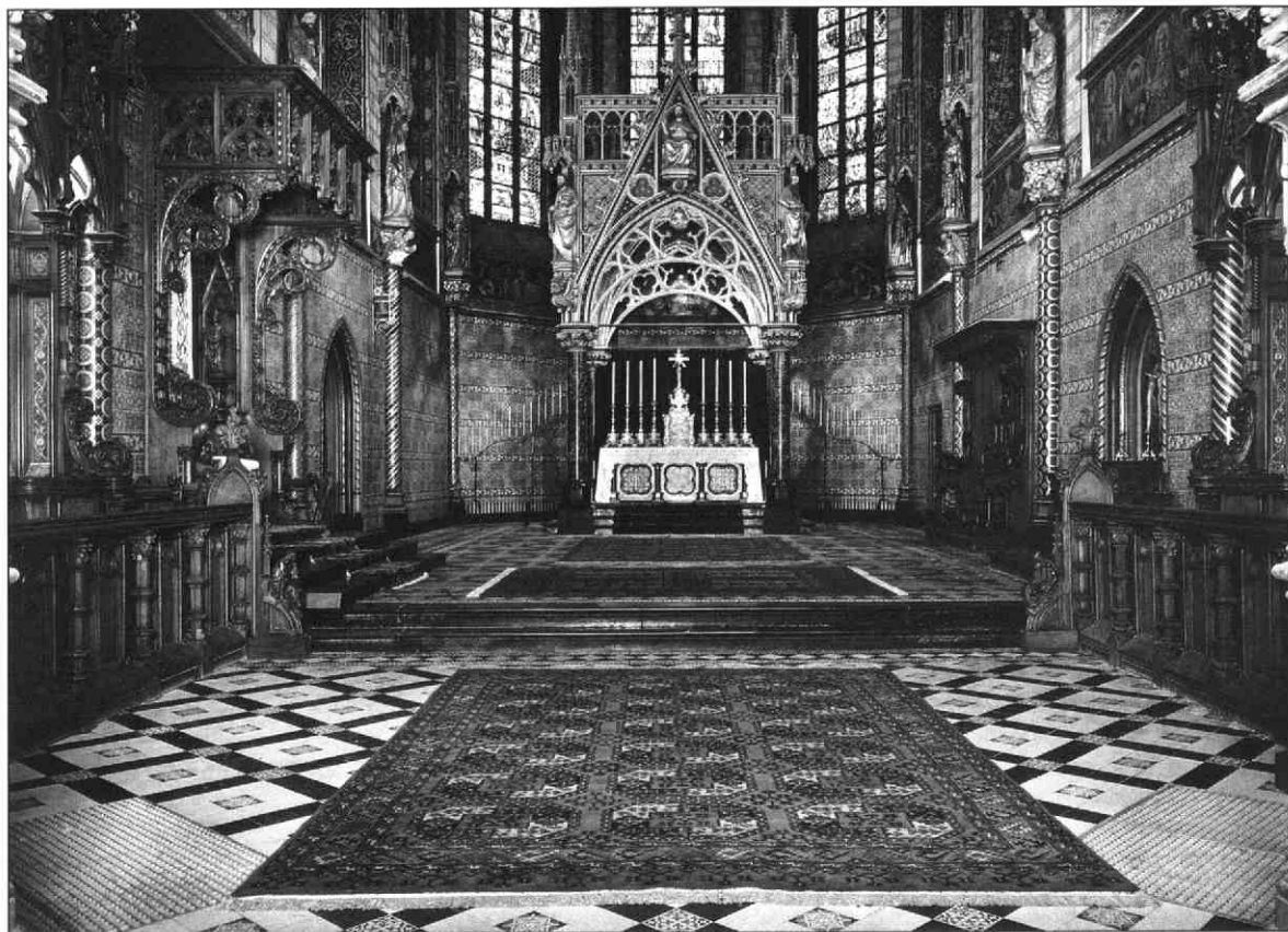
3. Interieur van het priesterkoor van de Catharina-kathedraal te Utrecht, 1948. Op de altaartombe staat het zeventiende-eeuwse zilver uit de voormalige schuilkerk aan de Catharijnesteege opgesteld.