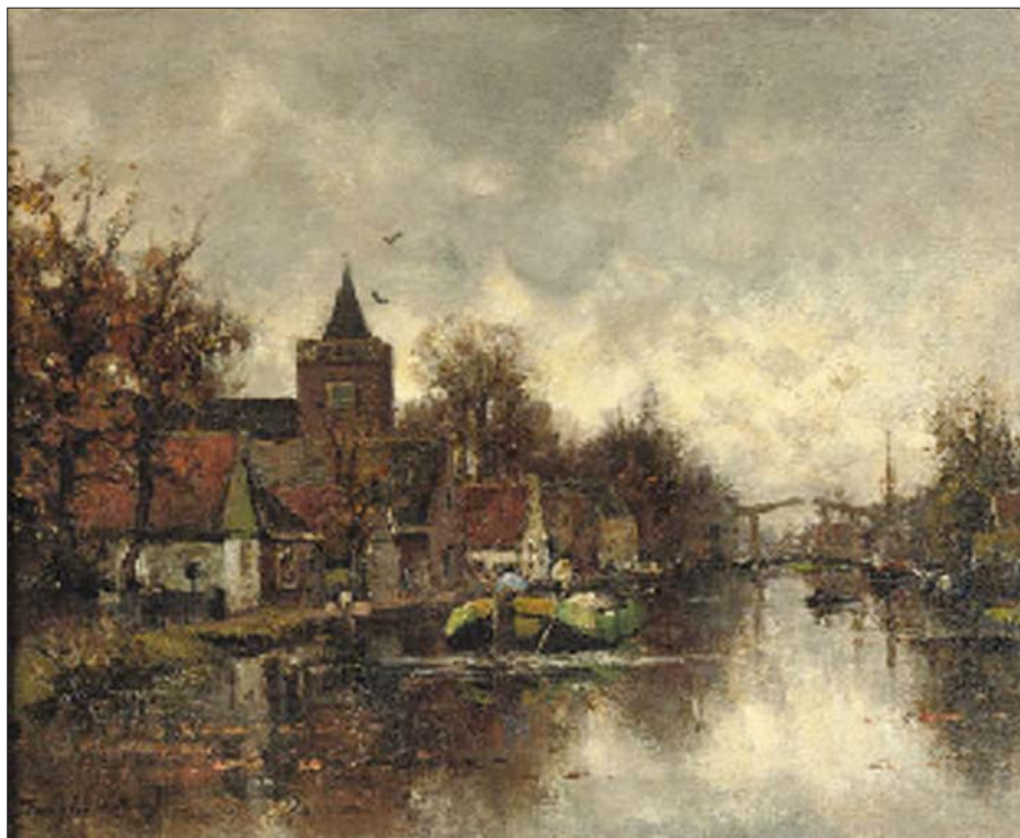
Zicht op Vreeland, olieverf op doek, 23 x 29 cm., geveild bij Christies Amsterdam op 27 januari 2008 (part.coll.)

eerder getrouwd was en hun eenjarige dochtertje. In het bevolkingsregister is niets te vinden van hun vestiging in dit dorp, waaruit blijkt dat het gezin waarschijnlijk in een pension was ingetrokken. Water, lucht en wolken, zijn favoriete onderwerpen, waren ook hier volop voorhanden. Bij de meeste Haagse schoolschilders was niet duidelijk te herkennen welke plek een schilderij weergaf. Du Chattel schilderde wel vaak herkenbare plekken en anders gaf hij het werk een titel, waardoor we ook bij plekken die niet goed te herkennen zijn weten dat we hier een gezicht 'Bij Vreeland' of 'Bij Nigtevecht' zien (afb). Het is echter niet zo dat Du Chattel geheel naar de realiteit schilderde; hij zette deze ook wel naar zijn hand en veranderde bepaalde zaken als dat beter paste in het coloriet of de compositie van het werk. Zo is op de drie hier afgebeelde gezichten op Vreeland ook drie keer een iets andere kerktoeren te zien! Op het olieverfschilderij heeft de kerk een groen luik in de toren, op de aquarel is de kerk witgepleisterd en op het tegeltableau is kerk het meest realistisch: slanker, spitser en met