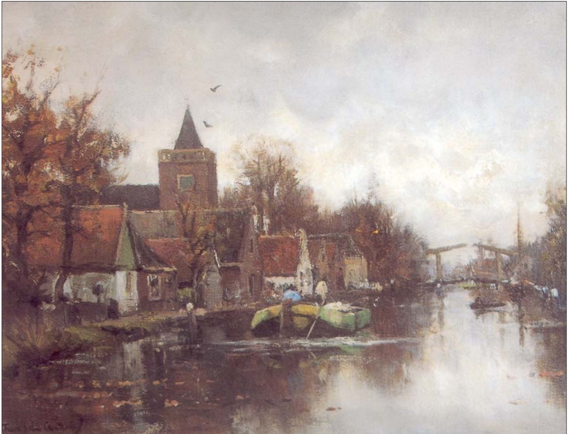
Aquarel van een zicht op Vreeland waarbij het middele deel overeenkomt met dat van het tegeltaleau, 50 x 66 cm (coll. Kunsthandel R. Polak te Den Haag)

Het is niet bekend welk schilderij precies voorbeeld is geweest voor dit tableau. Er zijn echter twee werken die ieder voor een deel een sterke gelijkenis vertonen met het tableau. De aquarel met het Zicht op Vreeland 4) toont het dorp vanuit de zuidkant, met de (hier witgepleisterde!) kerk rechts (afb). Op het tegeltaleau is Vreeland