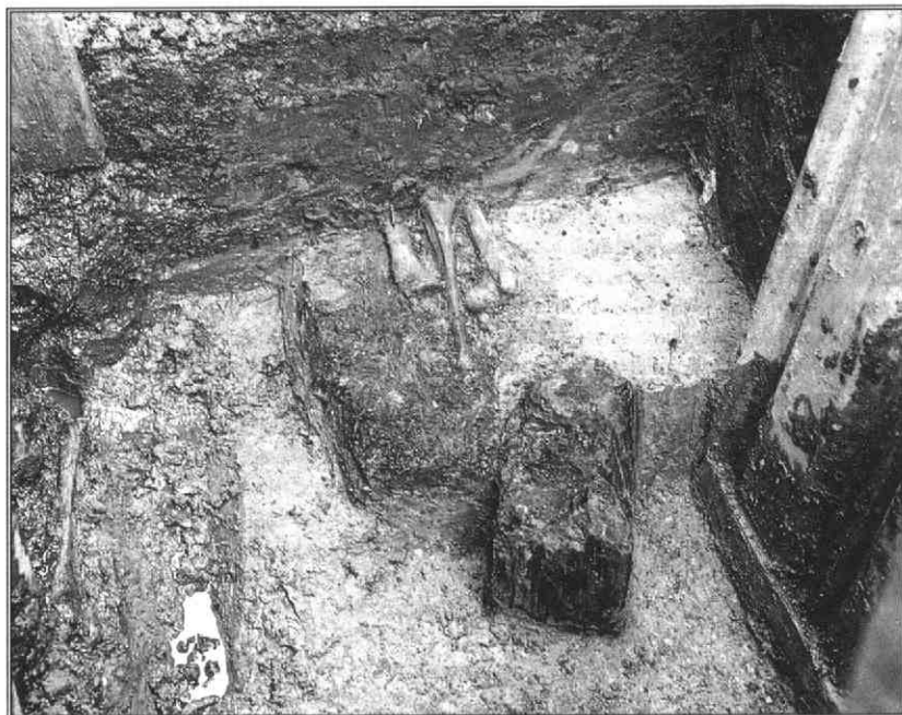
Afb. 2 Begravingen aangetroffen bij een opgraving aan het Oudkerkhof.

wachten zijn. Deze maaiveldhoogte komt overeen met die welke is gevonden binnen het castellum vanaf de laatste Romeinse bouwfase tot aan ruwweg de Karolingische periode 26 . Het Oudkerkhof was toen dus zeker geen lage, drassige rivieroever, maar een van de hoogste gebieden in de stad.