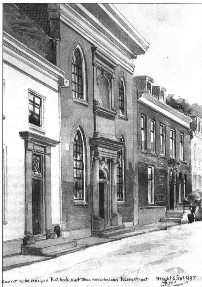
De voormalige St.-Willibrorduskerk in de Herenstraat, 1895. Aquarel door A. Grolman. GAU

Terug naar de subsidieaanvraag van Hartman. De aartspriester merkte al snel dat de stad Utrecht bij de plannen dwars lag. Het stadsbestuur erkende weliswaar de slechte toestand van het kerkgebouw aan het Dorstige Hartsteegje, maar begreep niet waarom uitbreiding nodig zou zijn. De augustijnerkerk was net gebouwd, de Catharijnekerk zou binnenkort worden overgedragen en de oude augustijnerkerk aan de Herenstraat stond leeg. Boven-