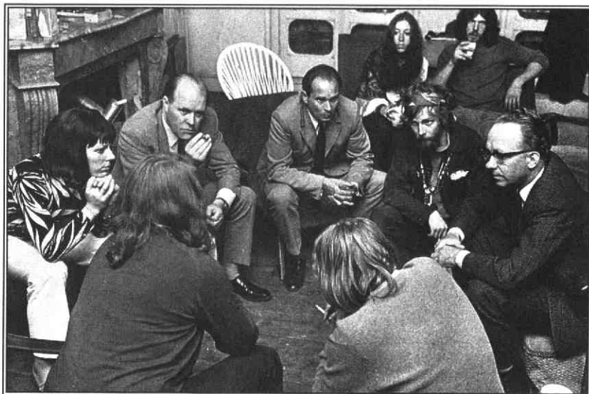
Krakers in gesprek met gemeenteraadsleden, ca 1970