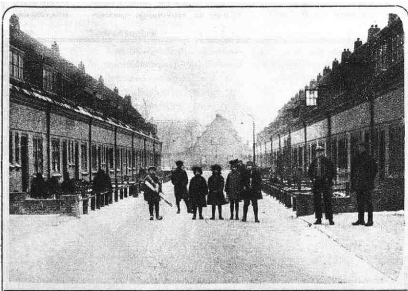
Ook de Framboosstraat toont aan op wat voor keurige wijze er in de laatste jaren voor de volksklasse gebouwd is.