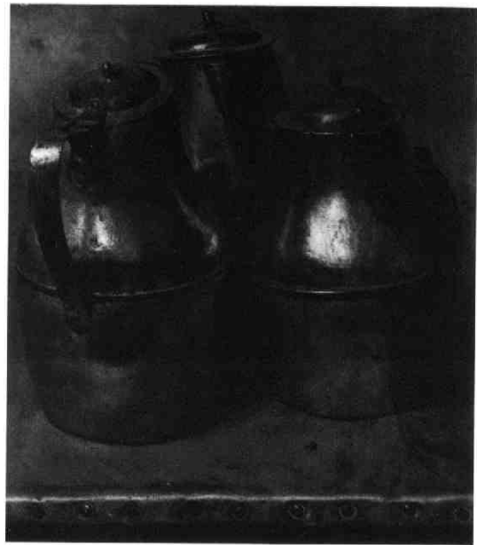
Verster (1861-1927), Blikken kannen, 1905; olieverf op paneel, 35,7 x 31 cm Centraal Museum Utrecht, bruikleen Stichting Van Baaren Museum.