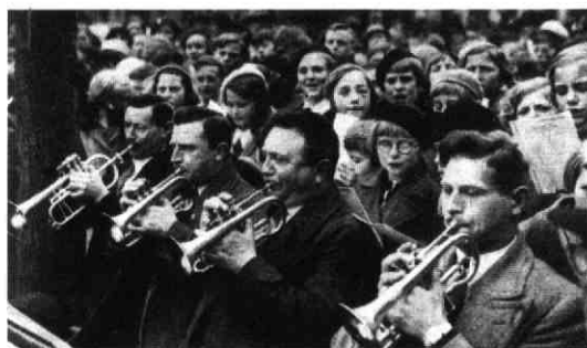
De mannen van het Kon. Utr. Dilettanten Orchest zorgden er wel voor, dat de Jeugd het spoor niet bijster raakte, en goed in de wijs bleef. Hieronder: ook de studenten van het U.S.C. brachten des middags voor de sociëteit aan het Janskerkhof de kinderen bij elkaar, om tesaamen, onder leiding van „Coers Lied“ de vaderlandsche liederen, over het plein te doen schallen. Duizenden jongens en meisjes verdrongen zich voor de „soos“, en zongen, dat het een lust was om te hooren

«Een mooi staaltje van volksopvoeding was de oprichting van de 'Vereniging van het Nederlandsche Lied' in 1904. De doelstelling spreekt voor zich: "De Vereniging stelt zich ten doel de beoefening van het Nederlandsche Lied te bevorderen, het te verspreiden, in ruime kring bemind te maken, ook onder het volk ingang te doen vinden en smaakbedervende liederen en vooroordelen omtrent het lied te bestrijden." 3