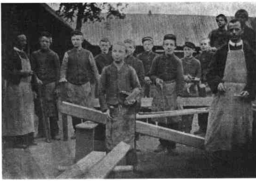
'De Jongs-Timmerlieden' Deze en vorige foto uit: 'Zevenendertigste verslag van het St. Aloysius- Gesticht "De Heiblom", 1898.'

zorgde voor een gezonde leefomgeving (een schoon huis, voedzame maaltijden), waardoor bij de overige gezinsleden een "thuis-gevoel" ontstond. Deze zouden niet langer hun vrije tijd op straat of in de kroeg doorbrengen. De echtgenoot leverde de gezinsinkomsten voor de instandhouding van dit "thuis". De kinderen tenslotte gingen regelmatig naar school om zich voor te bereiden op hun toekomstige rol als nuttige leden van de samenleving.