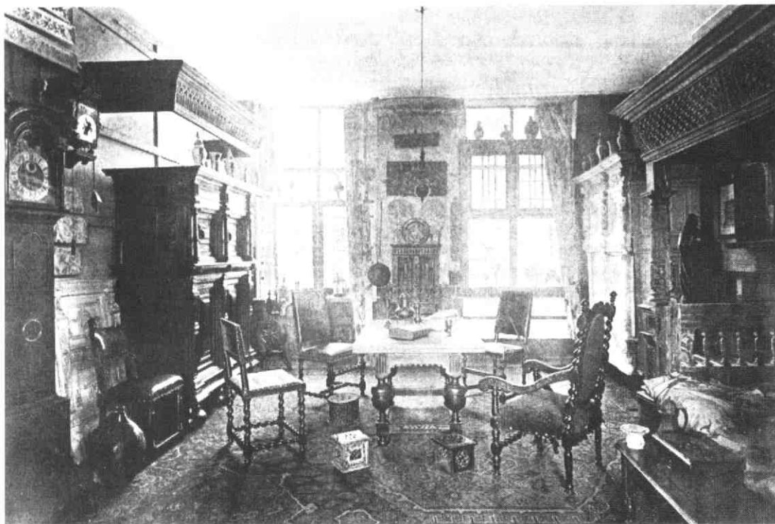
Een van de zalen van het museum, ingericht als kamer in de stijl van de Hollandse renaissance. Illustratie in de catalogus van 1902. GAU, arch. MvK, inv.nr. 10.

zeer te spreken over de boogopeningen die in de muren waren aangebracht. Vanuit de hal met het portiershokje had men daardoor "het doorzicht naar al de vertrekken". De kleuren van wanden en vloer - geel, bruin en grijs - vormden "een uiterst passende, warmen achtergrond". De journalist vond het "een vriendelijk, gezellig, smaakvol en hoog interessant museum". Ook het onderwijs wordt in zijn uitvoerige verslag genoemd: "En waarlijk, voor hen die zich op deze studie toeleggen, wordt ambacht en nijverheid geadeld tot kunst". In verband met de verbouwing was het museum een half jaar gesloten. Op 30 november 1897 vond de heropening plaats, waarvoor men, evenals in 1884, bijeenkwam in het gymnastieklokaal van de Hogere Burgerschool voor Meisjes. Jhr. mr. Victor de Stuers, hoofd van de afdeling Kunsten en Wetenschappen van het Ministerie van Binnenlandse Zaken, hield bij die gelegenheid een rede over de geschiedenis van kunst en kunstnijverheid; hij wees daarbij ook op het belang van de combinatie van school en museum: "een kunstschool zonder museum doet denken aan een marine-instituut in Zwitserland" 9 .