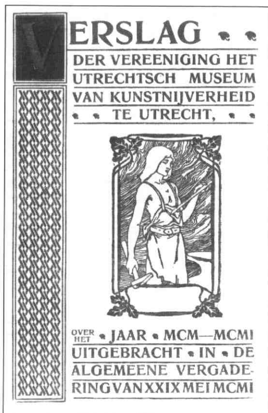
Jaarverslag over 1900-1901.

In de tien jaren die op de verbouwing van 1897 volgden, werden nog meer verbeteringen aangebracht. In 1905/06 was het dank zij een legaat mogelijk de ruimten op te knappen en de verzameling anders te rangschikken. In 1907/08 werden twee schoollokalen tot één verenigd en werden de oude lampen in alle schoollokalen vervangen door "hangend gloeilicht". Ondanks deze verbeteringen kreeg men steeds meer de behoefte aan andere huisvesting. Zowel voor het museum als voor de school waren de lokalen te krap. De geldmiddelen gingen echter achteruit door verlies van leden. Het jaarverslag over 1913/14 meldt somber: "In weerwil van de uiterste zuinigheid blijven de rekeningen tekorten aanwijzen. (...) Ons streven wordt blijkbaar door het beschaafde deel der burgerij nog te weinig gewaardeerd en ook bij de regeering wordt nog te weinig ingezien, hoezeer het kunstindustriële onderwijs tot vermeerde-