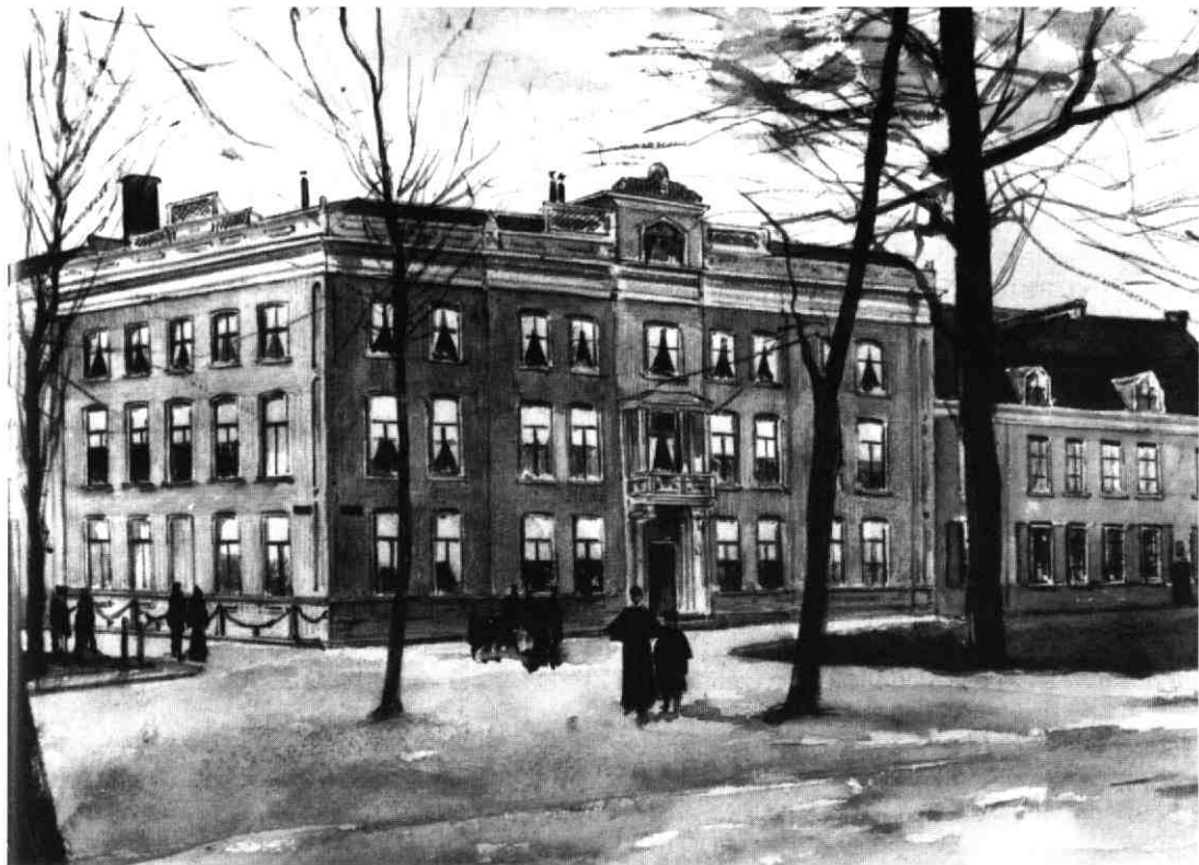
Het woonhuis en (rechts) het kantoor van de familie Kol aan het Lepelenburg. Aquarel van Anth. Grolman, 1897. GAU Top.Atlas T 2.35.

1888) ging de oude heer Kol van tijd tot tijd naar Duitsland om genezing te zoeken voor zijn kwaal. Bij zijn terugkomst placht hij dan voor ieder van ons iets mee te brengen, nu eens een aardig raedermesje, dan weer een portret van hemzelf. Hij werd ter aarde besteld in het familiegraf te Odijk en het gehele personeel deed hem uitgeleide.