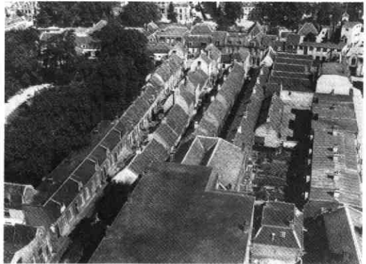
Gezicht op de Groenesteeg e.o. en het Oranjepark vanaf de toren van de Jacobikerk, 1934.

Op 1 september 1933 was het groot feest in wijk C. De vereniging 'Het Oranjepark' bestond namelijk vijftig jaar. 'Het Oranjepark' was sinds haar oprichting in 1883 een actieve buurtvereniging. Elk jaar werd er rond 31 augustus een daverend Oranje-feest georganiseerd om de verjaardag van Koningin Wilhelmina en de verjaardag van het park te vieren. Ook deze keer had de vereniging veel festiviteiten georganiseerd. Er werd zelfs een gedenkboekje uitgegeven, waarin ook een korte ontstaansgeschiedenis van het eerste echte openbare park van Utrecht werd gegeven.