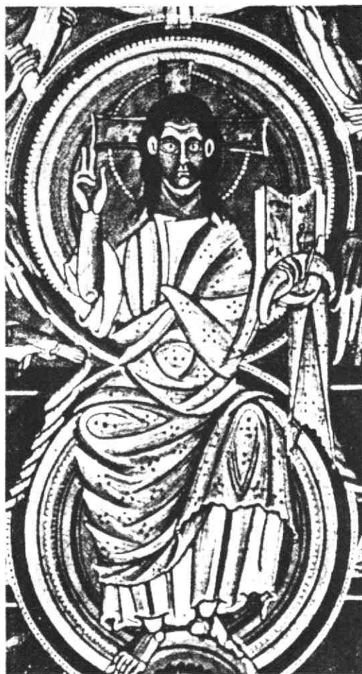
Afb. 5. De „Majestas Domini“ uit het Evangeliarium van het Keulse priesterseminarium, midden XIe eeuw. (Afb. 39 uit: Dr R. Berger, Die Darstellung des thronenden Christus in der romanischen Kunst , Reutlingen 1926.

Europa een nieuw gevoel voor waarden. in de bouwkunst uitte die zich door de constructie van de gewelven van de kooromgang van St.-Denis te Parijs in