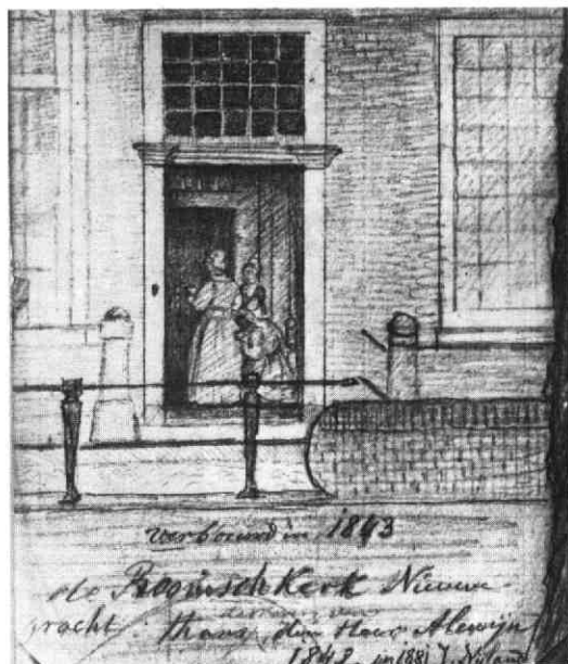
De eerste Jezuïetenstatie (Catharijnesteeg). Gezicht op de voorgevel der kerk aan de Nieuwegracht vóór de verbouwing van 1843, Gemeentelijke Archiefdienst Utrecht, Topografische Atlas Kb. 3. 1. (foto: Gemeentelijke Archiefdienst, Utrecht).

De ruimte die de kunstenaar bemeten kreeg voor het altaar was, afgaande op de huidige situatie, ongeveer zeven meter. Wat betreft de maten die het altaar heeft gehad, is ons alleen de breedte van het reliëf overgeleverd. Op de ontwerptekening hiervan heeft Verbrugghen een breedtemaat aangegeven van 7 voet 7 duim. Dit is bij benadering twee meter 23 ). De overige inscripties op de tekening duiden aan op welke wijze de kroonlijst door de Mariavoorstelling moet worden doorbroken, en wat de optische verhouding dient te worden ten opzichte van de voorstelling van Ignatius. Het veld dat op de grote ontwerptekening open werd gelaten, bevatte waarschijnlijk het schil-