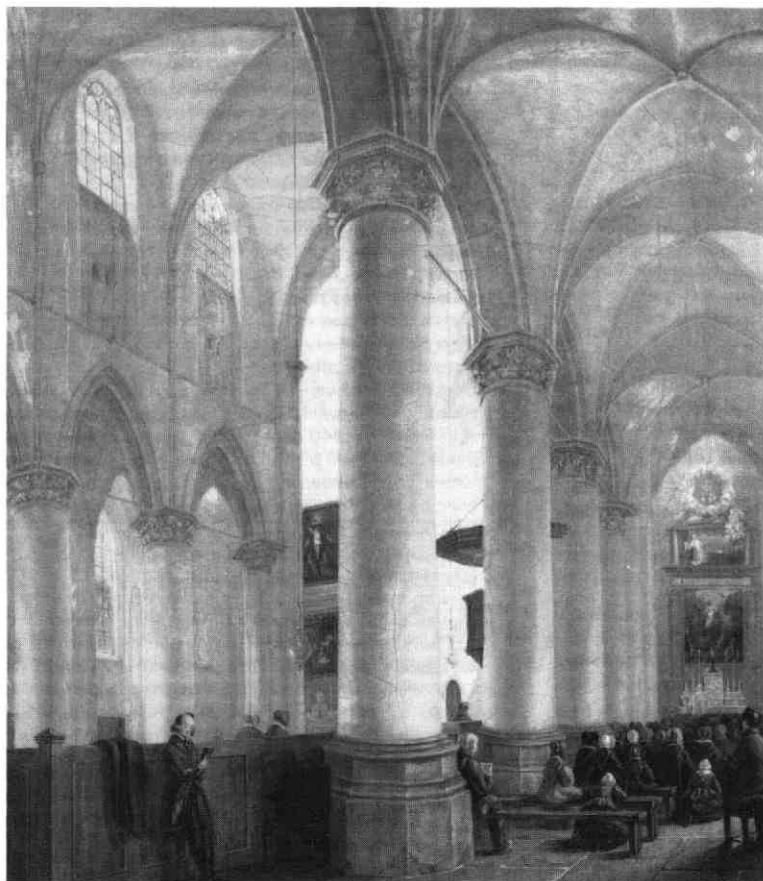
Gezicht in de St. Catharina-kerk vanuit het zuid-westen, A.W. Nieuwenhuizen, 1843, Olieverf op doek, 51,5 x 43 cm, Particuliere verzameling.

Het ontstaan van schuilkerken in de Noordelijke Nederlanden was het gevolg van het verbod van overheidswege om Rooms Katholieke erediensten te houden. In Utrecht kondigde de magistraat hiertoe op 18 juni 1580 een ordonnantie af „tegens de exercitie