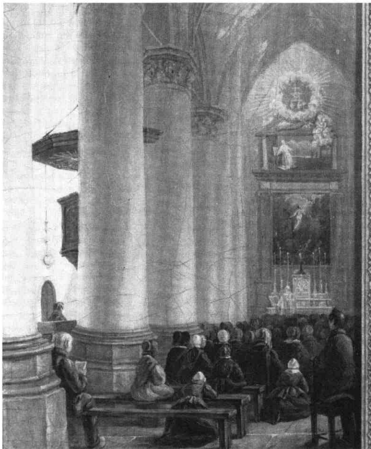
Gezicht in de St. Catharina-kerk vanuit het zuid-westen, A.W. Nieuwenhuizen, detail (foto: Rijksmuseum Het Catharijneconvent).

van de Roomsche Religie en het dragen van geestelijke klederen'' 5 ). De periode direct voorafgaand aan en volgend op dit verbod was van cruciaal belang voor de kerkelijke gezindte van de bevolking. Utrecht, dat gedurende de 17de eeuw een populatie van bij benadering 25.000 inwoners heeft gehad, telde in 1602 12.000 à 14.000 katholieken. In 1622 was het aantal communicanten geslonken tot 8.000 6 ). Een afname die men kennelijk niet vermocht te keren 7 ), wat niet vreemd is gezien het geringe aantal priesters dat werkzaam was in de Noordelijke Nederlanden gedurende deze periode. Rond de eeuwwisseling bijvoorbeeld waren slechts 70 priesters beschikbaar ter bediening van 1300 parochies 8 ) of staties.