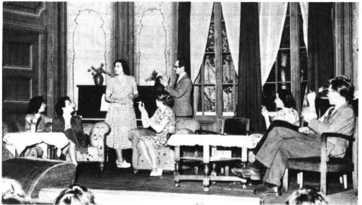
„Een zomerztheid“ in K & W.