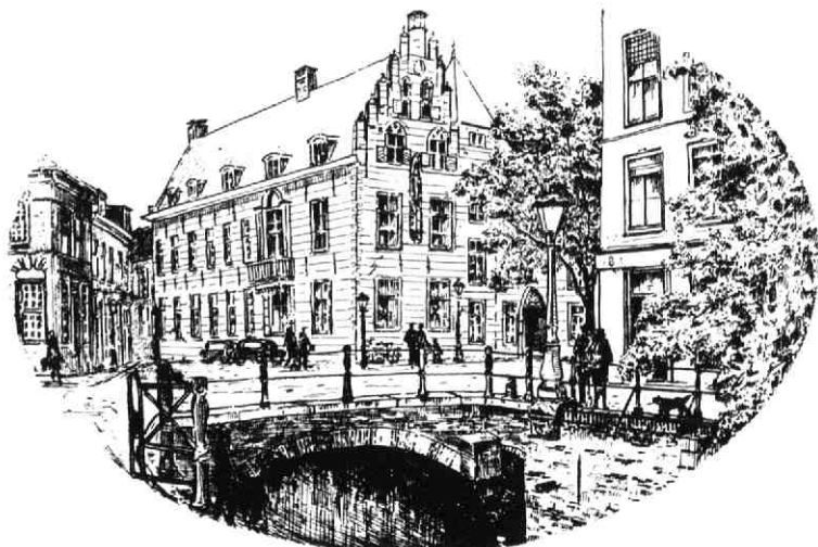
De Pausdam gezien vanaf de Nieuwegracht met in het midden het Paushuize. Ets van Anna Doedijns.

Een totaal andere aquarellist is Wout Heinen, met zijn