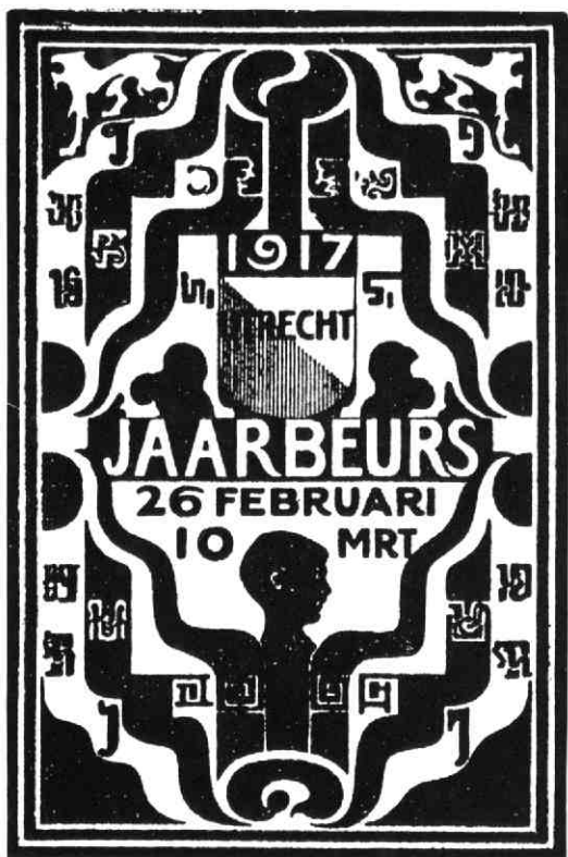
Het „logo“ van de eerste Utrechtse Jaarbeurs.

worden tot heil onzer nationale nijverheid en zoo van ons gansche volk“.