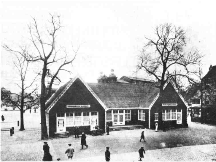
Het houten (nood)secretariaatsgebouwtje van de Jaarbeurs op het Vredenburg, ca. 1917. Foto: G.A.U. Top.-Hist. Atlas T 17.01.

klemtoonde de Raad van Beheer dat de Jaarbeurs een blijvende taak te vervullen had in het economisch leven na de oorlog.