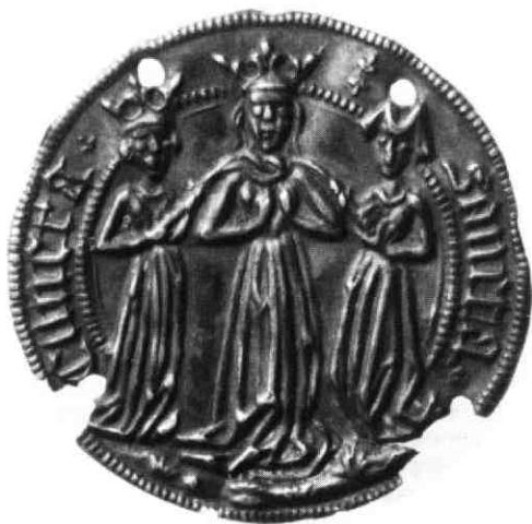
British Museum, inv. nr. 85, 5-6, 106.

Tussen de hoofden van Cunera en dienstmaagd staan twee kleine franse lelies afgebeeld. Het insigne is niet gegoten maar is ontstaan door het persen van de dun-