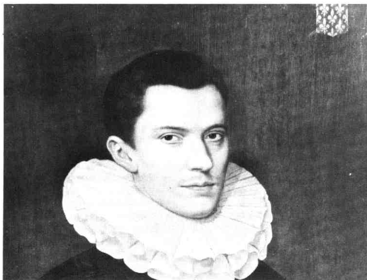
Daniël van den Queeborne toegeschreven. Portret van Nicolaes de Malapert, 1583 (?). (paneel, 60,5 x 51 cm).

Utrecht, Centraal Museum (Inv. nr. 8885; Schilderijen Catalogus 1952 nr. 1290).