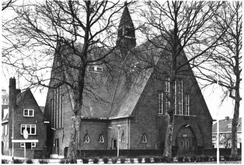
Exterieur van de Noorderkerk, gezien vanaf de Royaaards van den Hamkade, 1977. G.A.U. Top. Hist. Atlas Ke 4.7.

den verkocht 33 ). Heusinkveld ontwierp ondermeer, zoals te doen gebruikelijk, het front voor het nieuwe orgel. Omstreeks augustus kon het officieel door de Orgelcommissie aan de kerkeraad worden overgedragen 34 ). Doordat voordien een gift was ontvangen stemde de kerkeraad op 26 mei 1952 in met een voorstel van de Commissie van Administratie om de voornoemde orgelbouwer opdracht te geven om voor f 7.500, – met name het tweede manuaal van dit instrument uit te breiden 35 ).