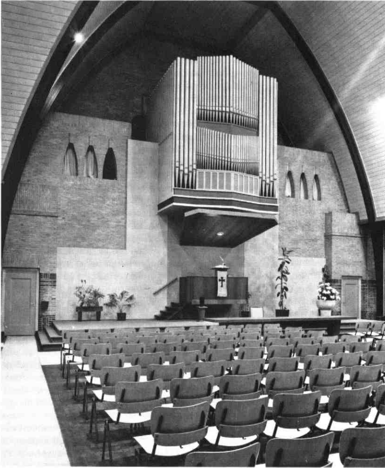
Interieur van de Noorderkerk na de in 1963 uitgevoerde verbouwing met het uit 1929 daterende orgel, 1977. G.A.U. Top. Hist. Atlas Ke 4.6.

als symbool en versiering, zo nodig als onderlegger van dominees preekboekje of psalmboekje te dienen". In de volgende vergadering kon al worden meegedeeld, dat een zuster uit de gemeente, die onbekend wilde blijven, een fraaie kanselbijbel-nieuwe vertaling in leren band, verguld op snede met koperen sloten aan de wijkraad had geschonken. Vanaf die tijd heeft de Ravesteyn-bijbel tot aan de verkoop van de Noorderkerk op een tafel op het podium voor de kansel gelegen 25 ). Inmiddels heeft deze, zoals vermeld, een plaats gekregen in het archief van de Bethelkerk.