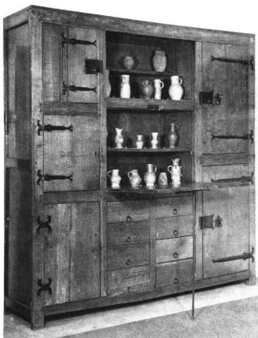
De archiefkast van het Domkapittel, 15de eeuw.

Andere onderwerpen dan de belastingkwesties zijn bij voorbeeld de contacten met andere vorsten en territoria en het functioneren van bisschoppelijke beambten, zoals de maarschalken. Tenslotte dienen ook de bemoeiingen met muntkwesties en de betrekkingen met de waterschappen te worden genoemd. In dit boek treft de hybridische verzameling onderwerpen waarmee de Staten zich bezig hielden. Maar dit vormt tevens het stimulerende karakter van het boek voor volgende onderzoekers, en mogelijk een element van discussie. Twee vragen rijzen namelijk. Is er een gemeenschappelijke grondslag van rechtstitels te vinden voor de bevoegdheden van de Staten, en zijn kapittel-generaal en Staten in de bronnen wel of niet van elkaar te onderscheiden? De studie van Van den Hoven van Genderen is zo belangrijk, en geeft zoveel stof tot discussie en verder onderzoek, dat het zinvol is nog aandacht te besteden aan institutionele kwesties.