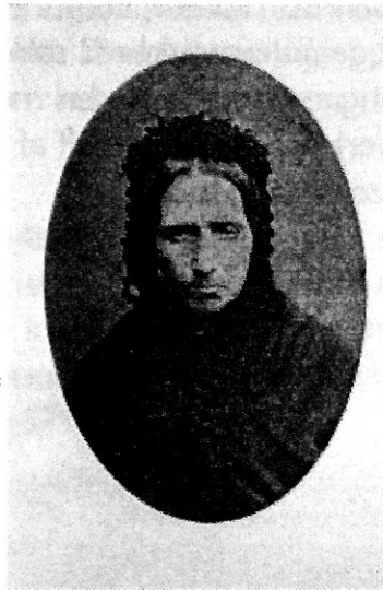
Afbeelding 3 Goeie Mie

De beruchte Leidsche gifmengster 'Goeie Mie', haar ware naam is Maria Catharina Swanenburg (1839-1915) 8 vergiftigde in Leiden ruim honderd personen, van wie er 27 overleden.