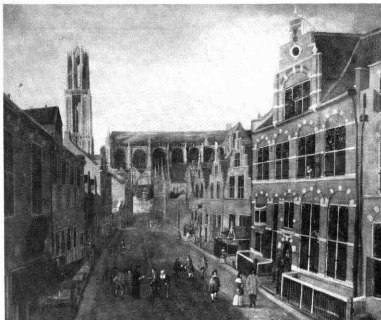
Afb. 1 „De Korte Nieuw- straat te Utrecht“ , schilderij door Fol- pert van Ouwen Al- len, 1655. (Centraal Museum, Utrecht).