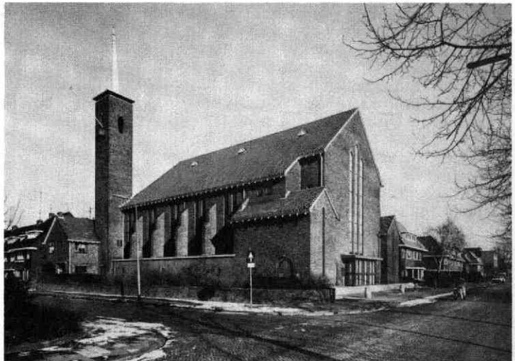
Afb. 4: Gezicht op de Tuindorpkerk op de hoek van de H. F. van Riellaan/Prof. Suringarlaan met de consistoriekamer op de plaats van het vroegere toegangsportaal.

De tweede verbouwing in 1977, waarbij veel gemeenteleden hulp boden, had veel ingrijpender gevolgen. Aangezien in de jaren zeventig de secularisatie ook binnen de Gereformeerde Kerk van Utrecht merkbaar was, werd ook de Tuindorpkerk in wezen te groot. Overigens moet hiernaast vermeld worden, dat het inwonersaantal van de stad Utrecht in die jaren al enige tijd terugliep 51 ). Als men bovendien nog weet dat de gereformeerden meer dan hervormden en katholieken plegen te verhuizen en zich buiten de steden vestigen, zoals uit de groei van bijvoorbeeld de Gereformeerde Kerken van Houten en Maarn blijkt, moet niet alles aan de secularisatie worden geweten 52 ). Op 17 januari 1963 nam het zielental van de Tuindorpkerk zelf aanzienlijk toe, hoewel dat zon-