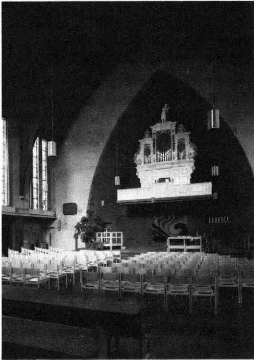
Afb. 3: Interieurfoto van de Tuindorperkerk in 1985 met zicht op het nieuwe ingerichte platform en het voormalige Oosterkerkorgel.

pen in, waarvan dan een voor centraalbouw. Tot dusver had hij zijn ideaal in minder vergaande vorm verwezenlijkt door bij de bouw van de gereformeerde kerken te Schiedam 42) en te Rotterdam 7) de door ir. B. T. Boeyinga ontworpen waaiervorm toe te passen 43) . Dat hij desondanks daarna driemaal een zaalkerk bouwde, hield wellicht verband met de voorschriften van de bouwopdracht. In de jaren 1935-1936 bouwde hij als eerste in deze reeks in opdracht van de Christelijke Gereformeerde Kerk van 's-Gravenhage de Jeruzalemkerk aan het Pomonaplein 44) . Hoewel kleiner van omvang vertoonde deze de nodige overeenkomsten met de Tuindorperkerk. Bij beide gebouwen werd het vlak van de zijgevel door vijf trapsge wijze inspringende „gesloten luchtbogen“ gebroken. Bij de Tuindorperkerk steunden deze op hun beurt op de vanuit de gevel naar voren uitstekende wandelgangen, die aan weerszijden van de kerkzaal lagen. Tussen en naast deze „luchtbogen“ bevonden zich zes langgerekte glas-in-lood ramen, die elk op zich uit twee ramen bestonden. Daarnaast ontvingen de wandelgangen hun licht door een gelijk aantal ronde meer donker gekleurde glas-in-lood vensters. Toen het ontwerp voor deze kerk werd goedgekeurd, legde Van der Kraan juist de laatste hand aan een ontwerp voor een gereformeerde kerk te Zuidlaren, waarvoor hij oorspronkelijk een soortgelijke vlakverdeling van