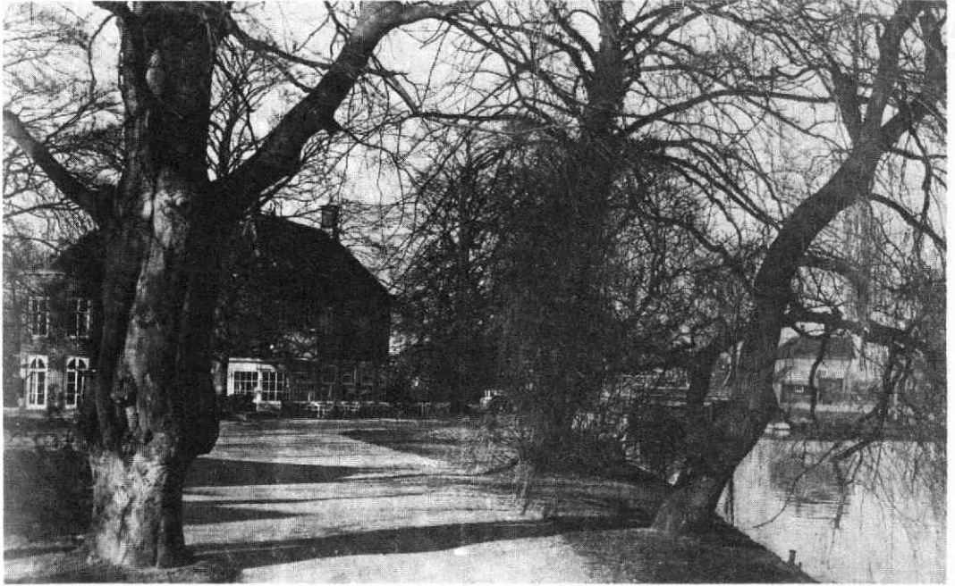
Exterieur van de buitenplaats Oog in Al (het thee-huis) 1923-1935.