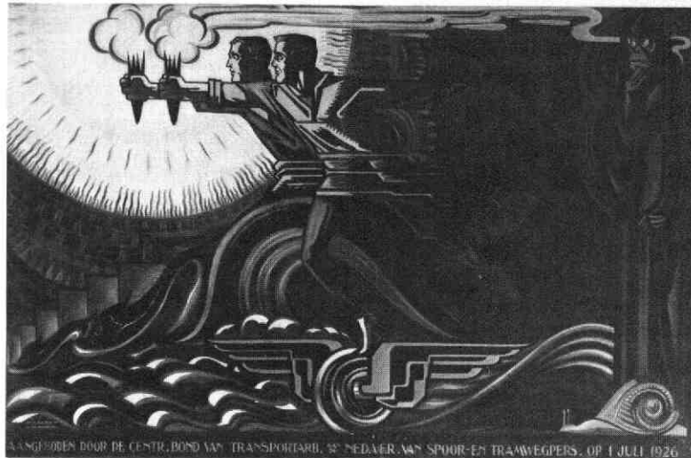
2. A. Hahn Jr., „Het Vervoer“, wandbeschildering, 1926. Utrecht, Centraal Museum. (Foto: Utrecht, Centraal Museum).

Zowel vader als zoon Hahn waren overtuigde socialisten. Hun overtuiging diende hen in belangrijke mate tot leidraad in hun werk. De artistieke produktie van Hahn Sr. en Jr. kan niet los worden gezien van de SDAP - de Sociaal Democratische Arbeiders Partij - en de daaruit voortgekomen socialistische partij van Dommela Nieuwenhuis. Het strijdbare karakter, zoals dat vooral in politieke prenten en affiches uit de twintiger jaren tot uiting komt is ook herkenbaar in de decoraties uit het NV-Huis (afb. 1 en 2). Deze wandbeschilderingen dragen de gedachte uit, dat het socialisme nieuwe idealen brengt in het leven van de mens: eenheid en harmonie.