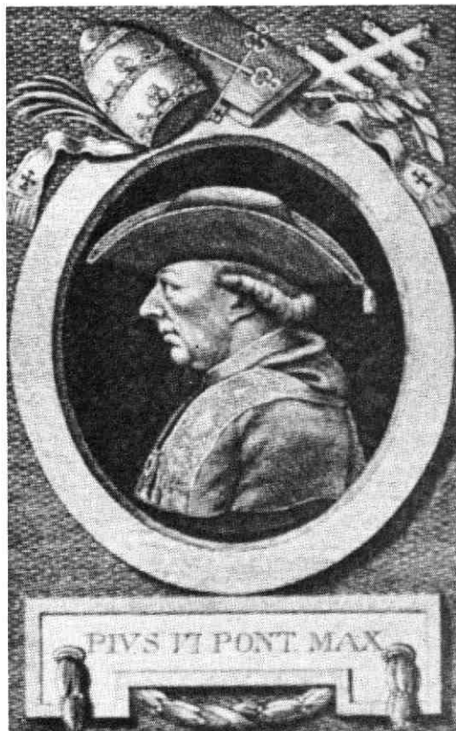
Voorbeeld van het gebruik van een tweemaal herkruist kruis als pauselijk embleem. Een portret van paus Pius VI Braschi (1775-1799).