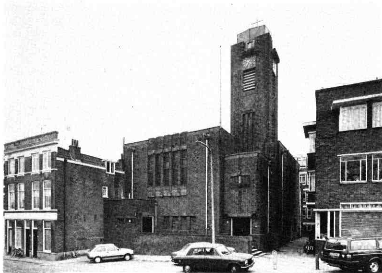
Gezicht op de voorgevel van de Zuiderkerk vanuit het noorden, maart 1986.