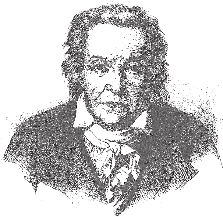
Pestalozzi op latere leeftijd (tekening van G.A. Hippius, ca. 1820)