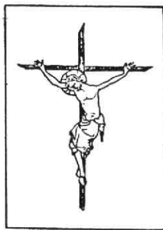
Fig. 11. 2 e NOUÏT DU SIÈCLE.

Op het volgende, ontbrekende fragment zou dan de naar links of naar rechts gedraaide, andere voet moeten komen. Het bovenste deel van het onderbeen, waar de zichtbare tenen bij horen, komt op het volgende fragment voor. Ter weerszijden ervan hangen rode plooiën neer van de lendendoek of perizonium, waarvan het verdere verloop op het fragment erboven te volgen is. Dit betekent, dat de heupen en het