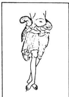
Fig. 18. 2 e TIERS.

bovenlichaam van het Crucifix zich aan de linkerkant van het kruis bevinden. Boven- en onderbenen vormen een hoek, die iets groter is dan 90°. De afstand vanaf het denkbeeldige kruispunt van de kruisarmen tot de lendendoek in aanmerking nemende, laat geen verticaal geplaatste romp van de Gekruisigde toe. Het bovenlichaam moet dus schuin naar boven geschilderd zijn, waarbij de plaats van het hoofd rechts onder het kruispunt van de balken gezocht moet worden. Het Crucifix zou er dan uitgezien moeten hebben als aangegeven is op fig. 11, behorende bij het overzicht van Crucifix uit de tweede helft van de XIIIe eeuw, met dien verstande, dat het perizonium waarschijnlijk eenzelfde pof of stofpobolling vertoont als op fig. 18 voorkomt 4) . De pof is naast de mouw van Johannes zichtbaar. (Zie de reconstructietekening). Van de XIIIe eeuwse kruisen is bekend, dat de kleur ervan in de miniaturen, op émaïlles en glas-in-