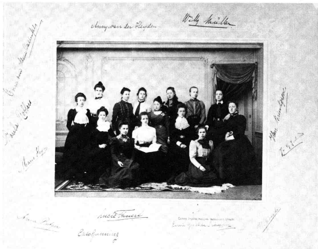
Leerlingen in 1892.

Voortaan zouden zij op dinsdagmorgen catechetisch onderwijs in het schoolgebouw geven 13 ).