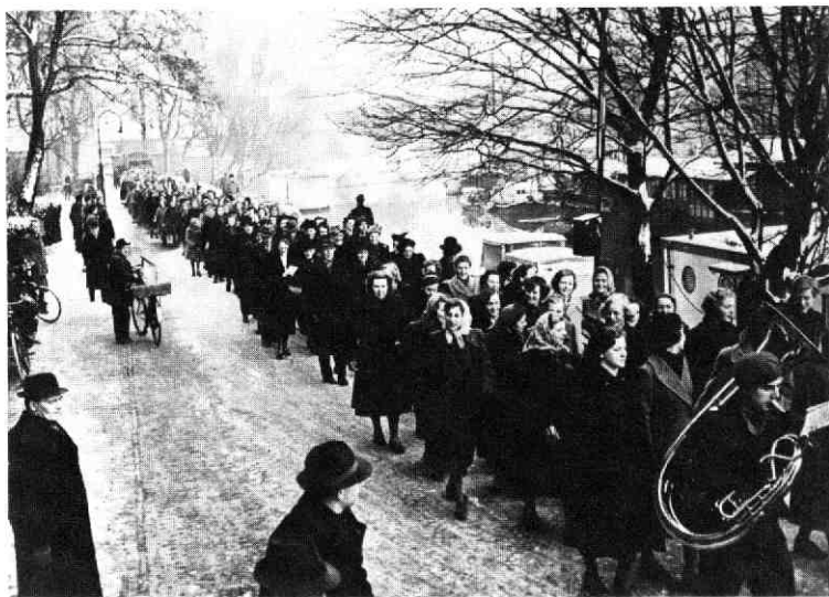
Het 75-jarig bestaan van de H.B.S. voor meisjes te Utrecht. Docenten en leerlingen op weg naar de plechtige herdenking in de Pieterskerk, 19 december 1950.