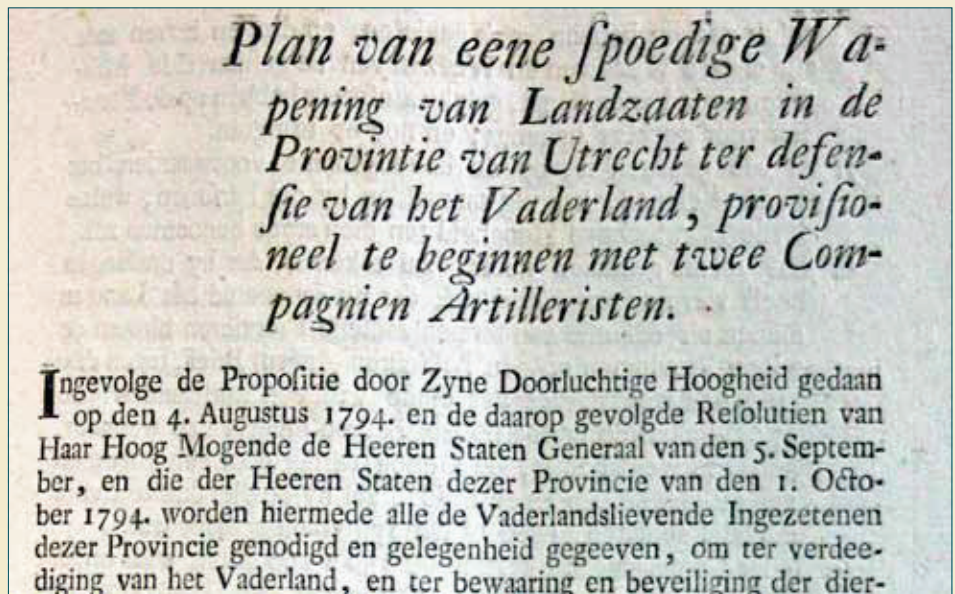
Publicatie Staten van Utrecht van Plan van Wapening Landzaaten.