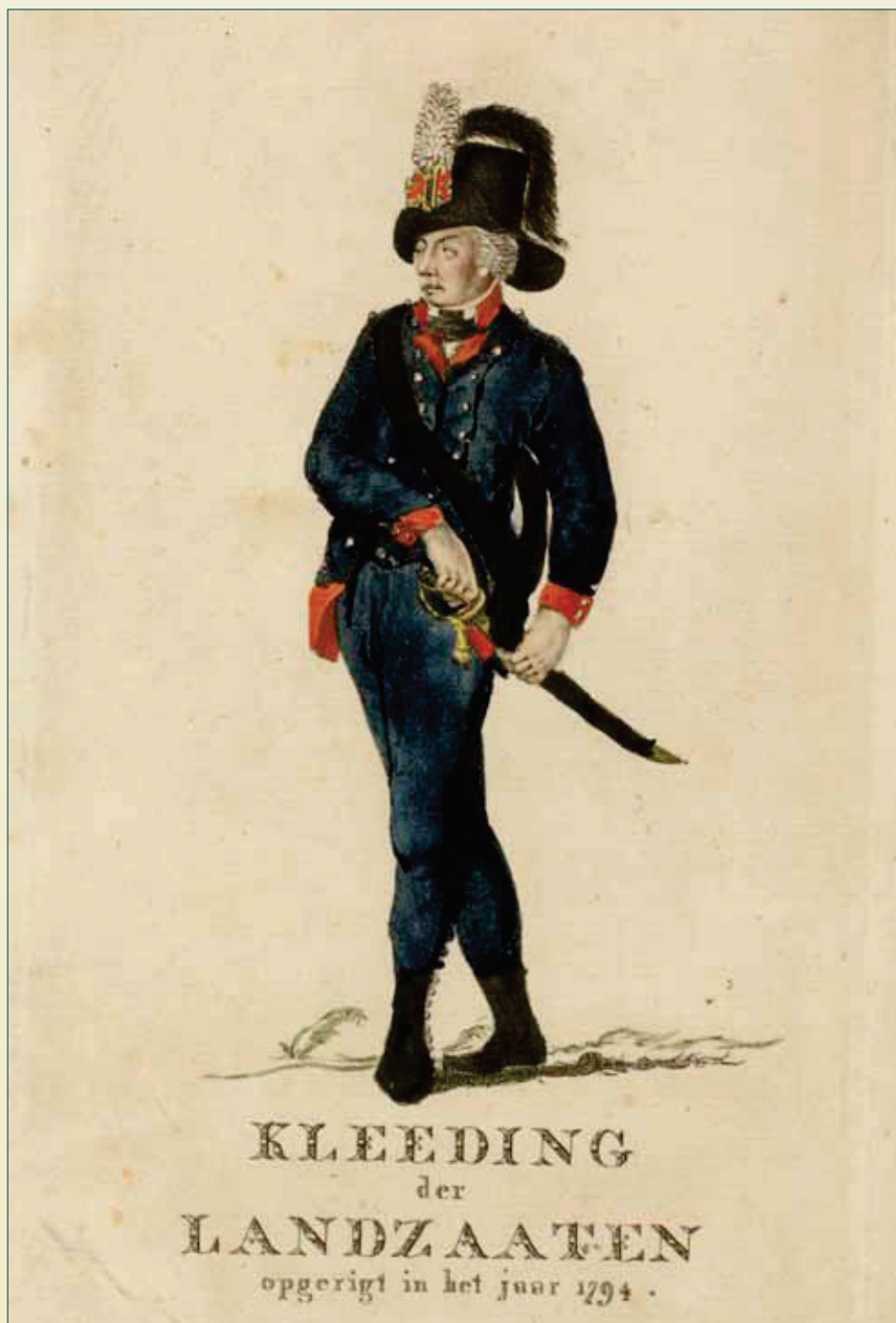
Kleding der landzaten, 1794. Aquarel.

Even leek het erop dat er eigen initiatieven ontstonden om korpsen te werven. De heer van Nijenrode organiseerde in de kerk van Breukelen een bijeenkomst om in te tekenen. Hevig verontwaardigd riepen de Staten van Utrecht schout De Jong van Breuke-