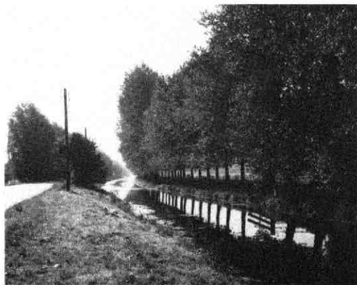
afb. 2. De Langbroekerwetering.