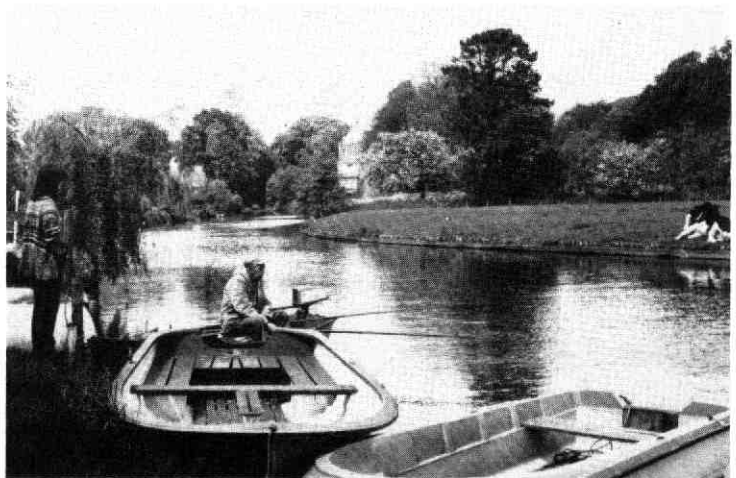
afb. 6. Extensieve recreatie: vissen langs de Kromme Rijn.