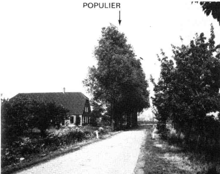
afb. 8. Populieren accentueren het bebouwingslint de Wijkersloot.