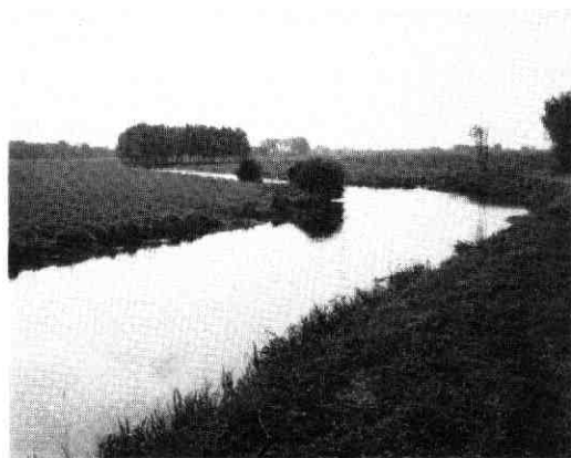
afb. 1. De Kromme Rijn.

Ten slotte is er de zorgelijke financieel-economische situatie voor de bos(landgoed)-eigenaren waardoor