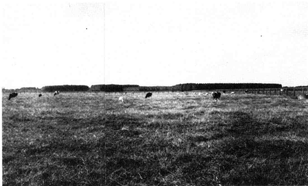
afb. 9. Polder Vechter- en Oudwulverbroek

Een bedreiging vormt de bouw van Groot Houten in de polder Vechter- en Oudwulverbroek. Deze polder is van oudsher nat en onbebouwd. Het is een weidestreekgebied.