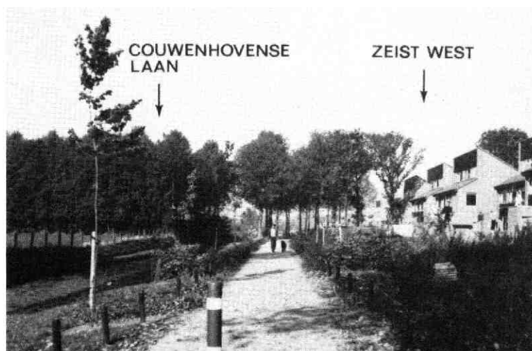
afb. 5. Woningbouw in Zeist-west.