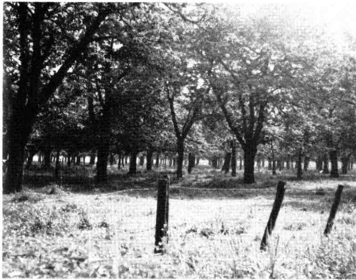
afb. 7. Boomgaarden tussen Cothen en Wijk bij Duurstede.

nog in beperkte mate. De kern van het gebied, waar nu een concentratie van niet opengestelde landgoederen ligt zou blijvend als z.g. „rustgebied” moeten fungeren.