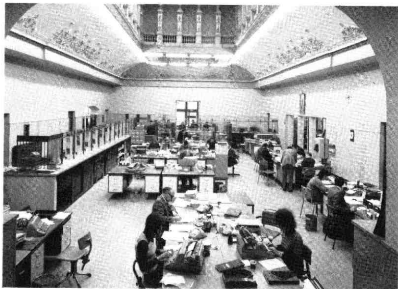
Afb. 4. De grote kantoorzaal van de bank Vlaer en Kol (nu Amro Bank) in het vroegere winkelpand aan de Oudegracht, gezien in de richting van de ingang; boven is een gedeelte van de galerij met de „hermen“ te zien. Top. Atlas nr. T 2.36.8.