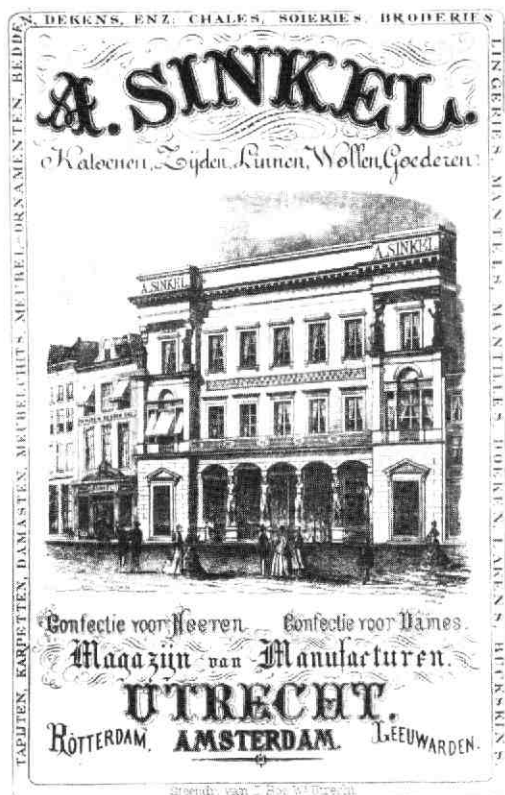
Afb. 2. Reclamebiljet, ca. 1890. G.A.U., bibl. Utr. nr. 5473 xx (112).

noch Engeland er een toonen kunnen 19) . Het gebouw was opgetrokken in neo-classicistische stijl, compleet met zuilen, timpanen en kariatiden. De kariatiden - als steunzuil dienst doende vrouwenbeelden in Griekse gewaden - waren in de 19e eeuw vooral in Engeland populair. De grote voorbeelden uit de antieke kunst waren de kariatiden van het Erechtheion op de Atheense Akropolis. De 3½ meter hoge, nogal plumpe beelden van Sinkel waren vervaardigd van gietijzer; geen wonder dat de kraan op hun gewicht niet berekend was!