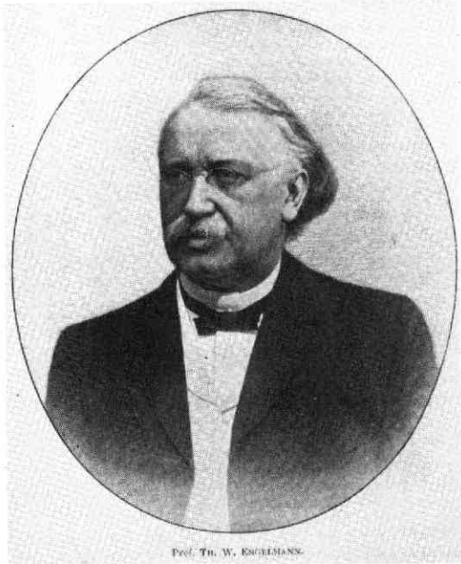
PROF. TH. W. ENGELMANN.