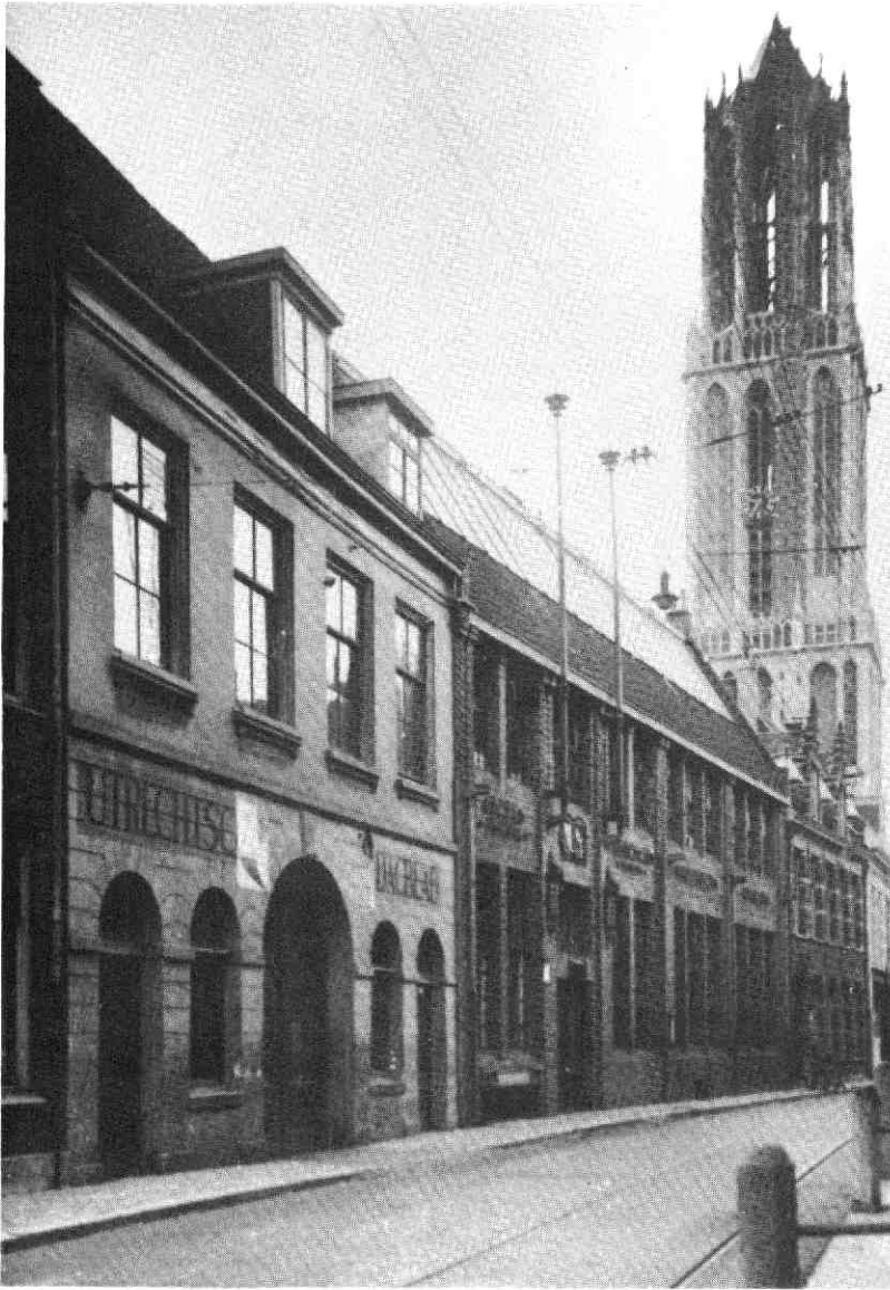
De drukkerij van het Utrechts Dagblad aan de Korte Nieuwstraat nr. 5, c. 1930.

overeengekomen normen werd betaald. Het uitgeven van het ochtenblad maakte een nachtedactie nodig, met als gevolg uitbreiding van de redactie. De oplossing werd gevonden in het aanstellen van een aantal vrijwilligers. Zij ontvingen f 25,- in de maand - zelf begon ik door een vergissing van de boekhouder met f 27,50, een voordeel waar ik één of twee jaar van heb geprofitteerd. De status van vrijwilliger bleef je houden, soms kwam er op 1 januari eens een tieltje bij je salaris, maar vaak ook niet. Toen in mei 1940 Nederland in de oorlog werd betrokken had ik een salaris van f 100,-, maar deed intussen wel dienst als chef van de nachtedactie, als roterend redacteur binnenland, als raadsverslaggever en als tweede tooneelrecensent en natuurlijk als verslaggever. Op 15 mei 1940 werden de salarissen met 10% verlaagd.