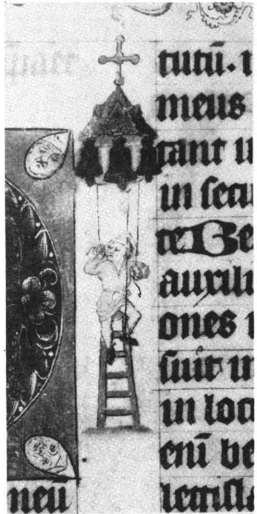
Een beierman, die met beide handen en één voet, drie klokken bespeelt.