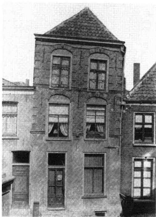
Een nu verdwenen oud huis in de Rijnstraat te Rhenen, nummer A.8

Het huis was, zoals duidelijk waargenomen kon worden door een langwerpige en getraliede uitkomsde op de brede voorliggende stoep langs de straat, gebouwd boven een overwelfde grote kelder en het bezat de allure van een hoge woning die vrij zeker nog grotendeels op de 16e eeuw kon worden gedateerd. Het lagere deel van de gevel was onder andere door het opsmeren van een cementlaag en het aanbrengen ener moderne, niet meer bijpassende deur met terzijde eenzelfde raam, aan de geest van toenmalig „nieuw-wets” bouwen en herstellen allerminst ontkomen. Dit was ook zo gesteld met het fries , dat daarboven de gehele breedte had versierd. Dit was namelijk grotendeels eveneens overgesmeerd, maar niettemin waren aan de beide uiteinden toch nog herkenbaar een beeldje van Eva en een van Adam. Ook in het cen-