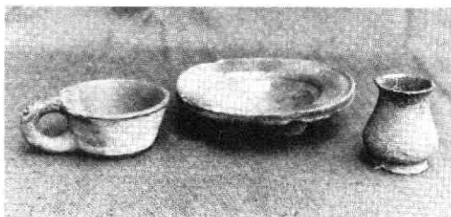
Kommetje, bordje en zalfpotje uit de 16e eeuw.

De plaats waar het stadje het Gein met het klooster gelegen heeft is te vinden aan de oostkant van de Doorslag, waar deze in de Kromme IJssel uitkomt. In