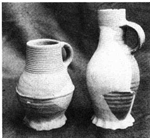
Gerestaureerde steengoed kannetjes uit de 14e (links) en 15e eeuw (rechts).

De zusters hielden zich bezig met het verplegen van zieken, handwerkonderwijs zoals spinnen, weven en breien, het schrijven van stichtelijke boeken, kleuren