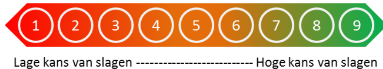
Figuur 10 Bepaling kans van slagen op basis van het aantal fitrelaties

Voor nu bepalen we de kans van slagen op basis van het aantal fitrelaties. In onderstaande figuur is weergegeven hoe de kans van slagen van een keteninitiatief bepaald kan worden op basis van het aantal fitrelaties. Indien er geen enkele fitrelatie is, is er geen sprake van een kans van slagen.