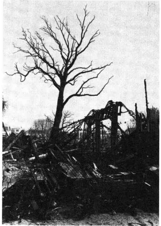
Restanten van het noodgebouw, een dag na de fatale brand, 1979.