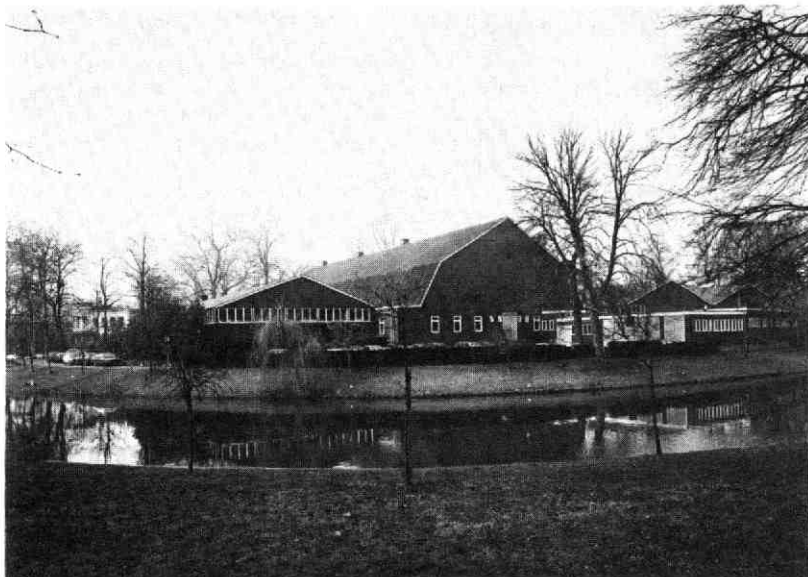
Het noodgebouw Tivoli op het Lepelenburg, 1978. Foto Gem. Fotodienst. GAU, Topogr. Atlas nr., X 3.2.2.4.