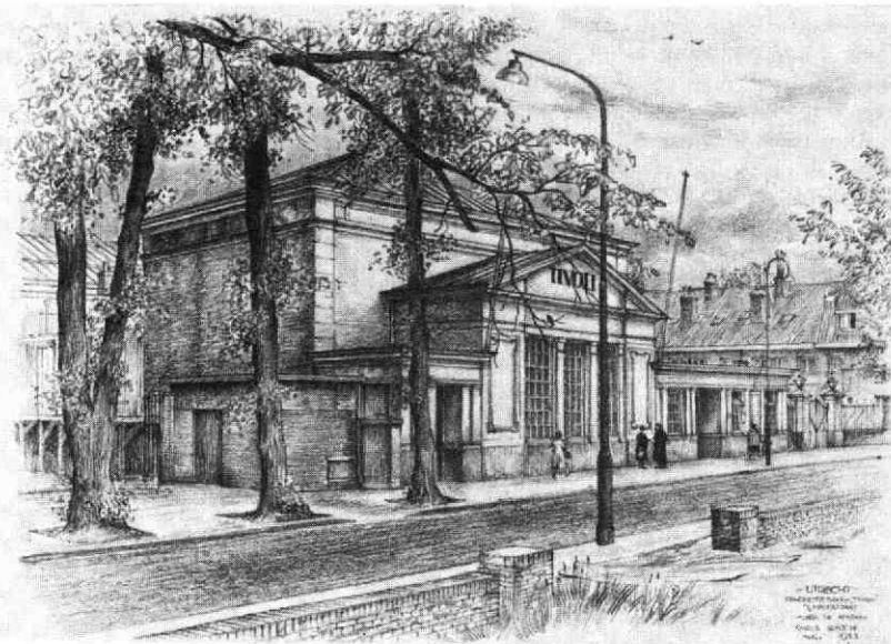
Het concertgebouw Tivoli aan de Kruisstraat, 1955.

Potloodtek. Chr. Schut. GAU, Topogr. Atlas, nr. X 3.1.7.