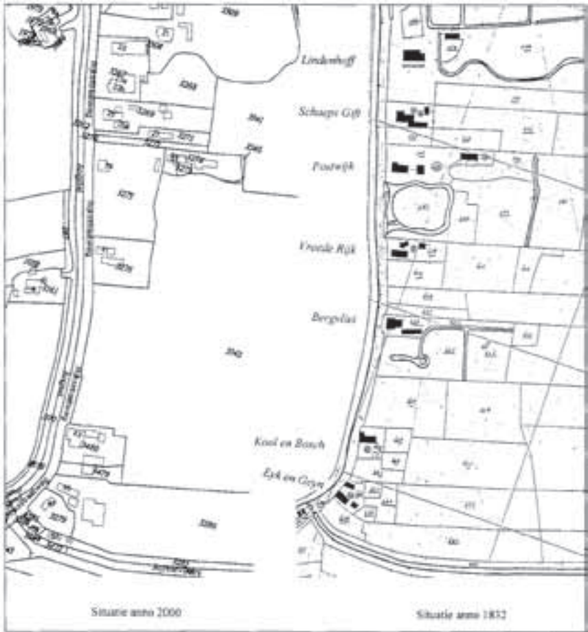
Afb. 3. Kadasterkaart nr. 3542 van het gebied van Vrederijk/Bergvliet.