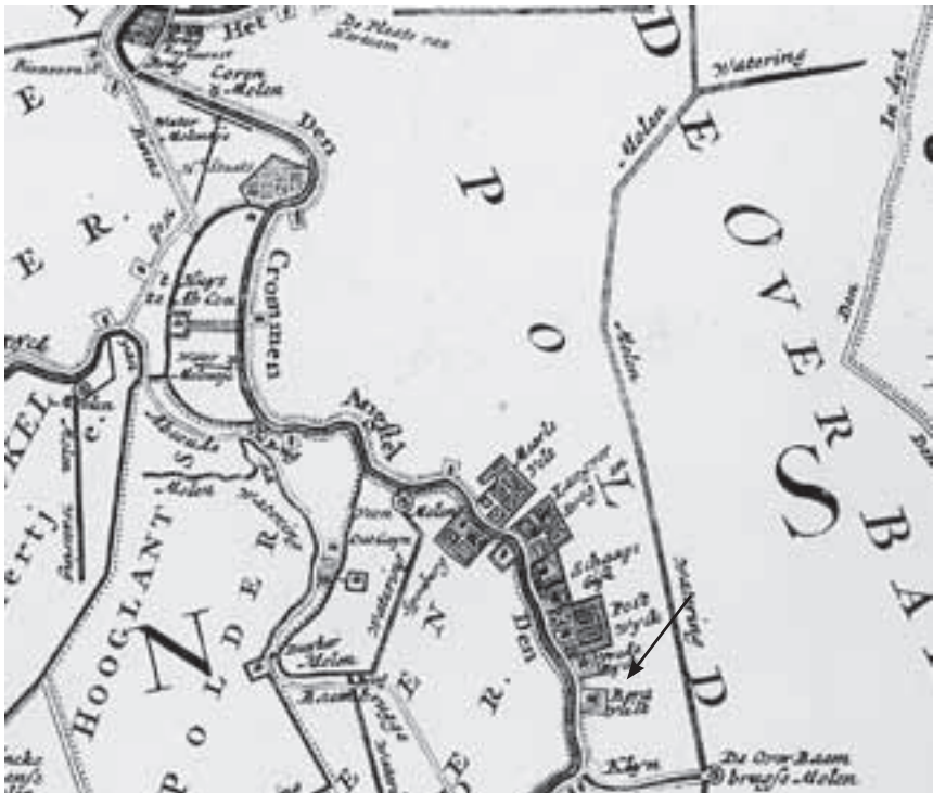
Afb. 1. Uitsnede uit de kaart van Gerit Drogenham uit ca. 1700 van het gedeelte van de Angstel tussen Baambrugge en Abcoude.

Nadat bij de beschrijving van de verdwenen buitenplaatsen langs de Angstel zowel aan de oostzijde als aan de westzijde van deze rivier de zuidgrens van het Gerecht Abcoude-Baambrugge was bereikt bleek nog één Plaats onbesproken te zijn gebleven, namelijk Bergvliet, gelegen direct ten zuiden van de wat meer bescheiden Plaats Vrede Rijk, aan de oostzijde van de Angstel (afb. 1).