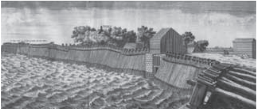
Afb. 4. De met houten palen versterkte Diemerzeedijk begin 18 de eeuw. (Coll. AGV)

vrij kon binnen komen, maar eenmaal vóór de kust van Holland en Utrecht geen uitweg had. Iedere generatie uit deze streek kon er wel op bogen een of meer grote overstromingen te hebben meegemaakt door dijkdoorbraken of anderszins veroorzaakt.