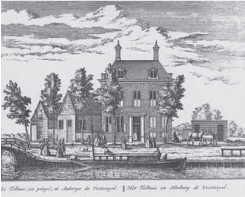
Afb. 7. De herberg Voetangel in 1730. ( Hollands Arcadia door A. Rademaker)

De la Croix is verder ongehuwd gebleven en besteedde zijn energie aan het opwaarderen van de boerderijen in de omgeving van zijn buiten. Hij ging in het begin van de 20-er jaren van de 18 de eeuw in de grondhandel omdat hij zag dat er nog steeds vraag was naar goed gelegen stukken grond om buitenplaatsen op te stichten. Hij kocht de grond van het ten oosten van Kievitsheuvel (dit buiten wordt later nog eens behandeld) gelegen Meer en Hoef 30 en wordt eveneens als eigenaar genoemd bij het nog oostelijker gelegen De Hoop . 31 Van een aanleg van een buitenplaats kwam het echter niet meer, hij leende er wel geld voor in 1726, 32 maar hij verhuurde Meer en Hoef in 1727-'28. Daarbij had hij geen gelukkige hand want zijn huurder was de chanteur Campo Weyerman, die zijn louche praktijken zou bekopen met levenslange gevangenstraf in de Gevangendoor in Den Haag. Natuurlijk kreeg De la Croix te maken met achterstalligheid van de huurbetalingen door Weyerman waarvoor hij de schout inschakelde. 33