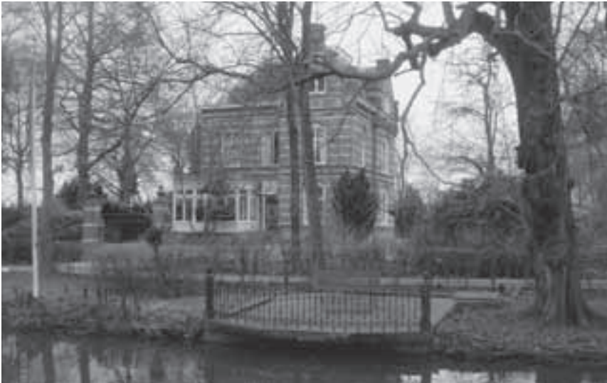
Afb. 6. Het huis Donkervliet in 2008.

wegingenieur, die in Zuid Afrika zijn sporen gelegd en verdiend heeft, in 1903 de eigendom verwierf, en zijn zoon Eduard die er tot 1949 woonde. Zo kan deze buitenplaats, zij het in geheel gewijzigde vorm, ook vandaag nog getuigen van vroegere rijkdom en lust tot ondernemen. 13