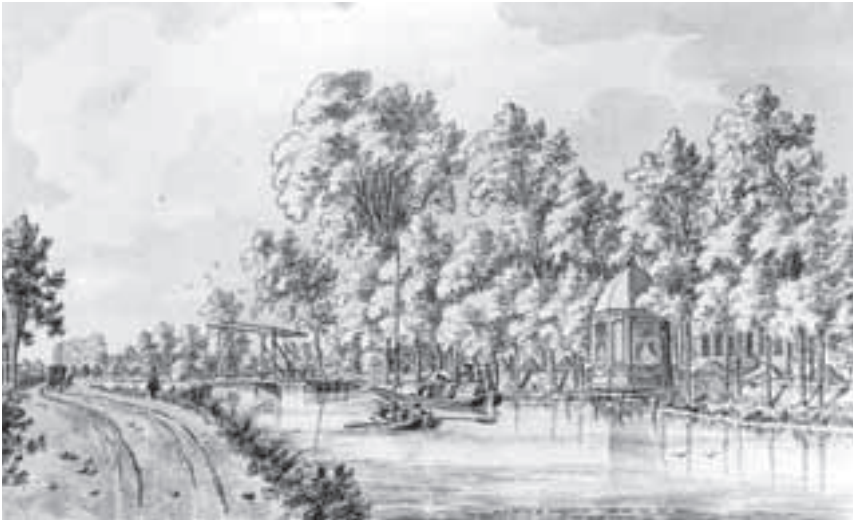
Afb. 3. De brug voor Donkervliet met rechts de vernieuwde koepel en achter het brugdek het speelhuis van Slootwijk. Onder de bomen zijn de ramen en de stoep te zien en de golvend geschoren haag voor het huis Donkervliet. Tekening uit ca.1755 door Dirk van der Burg (1723-'73) (Coll. Albertina Wenen).

schuin door de weilanden zo'n pad naar Baambrugge getekend, maar dat heeft er nimmer gelegen.