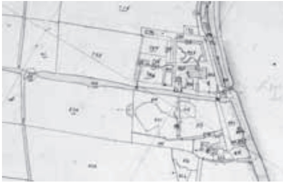
Afb.5. Minuut van de kadastraal kaart uit 1832. Bovenaan Donkervliet, daaronder Slootwijk, beide met koepel en aan het huis vast gebouwde boerderij. Tussen beide in de molenvliet met links de Donkere molen.

erven worden verdeeld. Daartoe vond de overdracht plaats aan Gerrit Rinses Voormeulen, die ook al bij de buitenplaatsen Ipenburg en Geyn Wensch ontmoet werd. 12