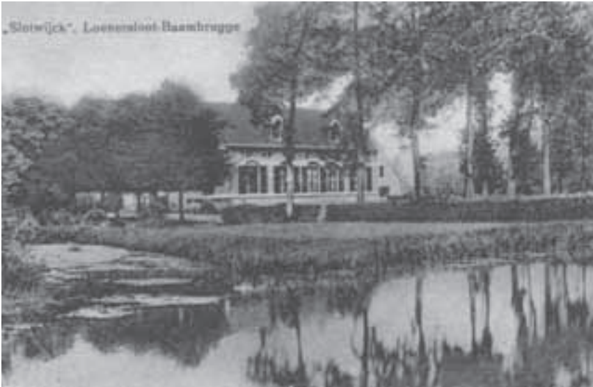
Afb. 7. Slootwijk, ingekleurde briefkaart uit ca 1920.