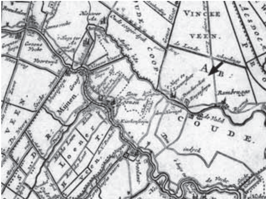
Afb. 1. Donkervliet op de kaart van Claes Jansz. Visscher uit 1675. Het noorden ligt rechts. Het naastgelegen Ruyteveldt wordt hier abusievelijk Ruytesteyn genoemd. De weg tussen 'Ruytesteyn' en Baambrugge is er nooit geweest. (Coll. Munnig Schmidt).

In het Jaarboekje 2006 kon de lange reeks van verdwenen buitenplaatsen langs de Angstel, voor zover gelegen aan de oostzijde daarvan, afgesloten worden met de ten noorden van het nog bestaande Valckenheining gelegen Den Haring. Met Valckenheining werd de grens van het Gerecht Abcoude-Baambrugge bereikt (Afb. 1).