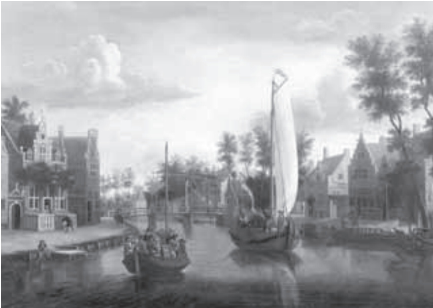
Afb. 13. Gezicht op Maarssen (zie afb. 9), door Jacob Storck. Van dit gezicht zijn tenminste zeven versies bekend (olieverf op doek, 58.6 x 82.4 cm, veil. Christie's Amsterdam, AMS 2640, 3-11-2004, cat.nr. 92).

(Afb.13) ter veiling, die de oevers van een positie iets verder naar het zuiden weergeeft. Verder wijken de twee schilderijen slechts door kleine verschillen, zoals de twee trapevels rechts, die in grootte verschillen, en andere plaatsing van de personen aan boord en op de wal, van elkaar af. Nog een derde versie van dit gezicht op Maarssen kwam schrijver onder ogen. 10 De linker helft van de voorstelling is vrijwel identiek met afb.9, de jaagschuit is echter rechts van de boeier geplaatst. Ook de overige huizen zijn gelijk aan die op afb.9 behalve dat aan de rechter zijkant, waar nu geen koepel te zien is maar een groot huis in de trant van het oude Herteveld achter een hoog hek. Daarvoor ligt een trekjacht met de boeg tegen de steiger.