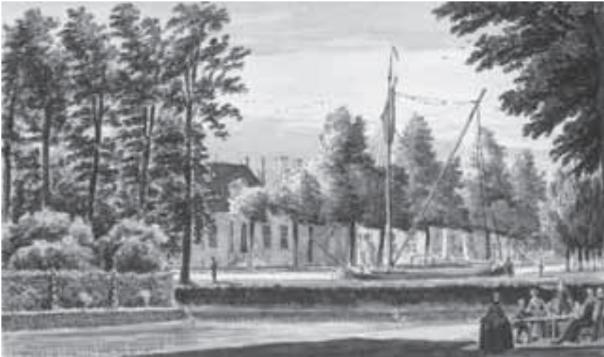
Afb. 6. Gezicht op Nieuwersluis door H.Spilman. Achter het binnenvaartschip is de brug in de Herenweg te zien met daarachter de herberg en rechts het Gemeenlandshuis. Op de plaats van het gebouw links, met de dubbele stoep, staat nu het Arsenaal (aquarel, 12.7 x 19.6 cm Kon.Huisarchief MCS/811).