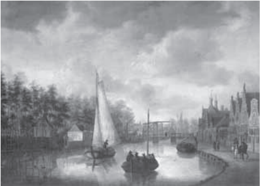
Afb. 10. Gezicht op Maarsse vanuit het zuiden, ca.1664, links het park met twee gebouwtjes van Huis ter Meer, rechts de Lange Gracht, door Jacob Storck (olieverf op doek, 61.5 x 84 cm, veil. Sotheby's Amsterdam, 18, 19 en 20-02-2003 cat. nr. 241).

op de weergegeven wijze te zien en zijn dus voor het plaatje gemanipuleerd. Opmerkelijk is dat een zelfde type spiegeljacht als op het schilderij van Nieuwersluis, maar niet hetzelfde, voor de wal ligt. Het gaat duidelijk om stoffering van het schilderij.