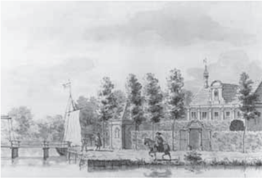
Afb. 3. Het buiten Schans Sight aan de oostkant van de Vecht bij de tolbrug over de Vecht te Nieuwersluis in 1672, door J. P. Serrurier ca. 1730 (gewassen tekening 18 x 26.5 cm, Foto RAU, cat. 1685).

pad en vertegenwoordigers van de burgemeesters van Amsterdam. Die vergaderden daar over het onderhoud van het Zand- en jaagpad. 6 De herberg, sinds het einde van de 19 de eeuw De Kampioen geheten en de laatste jaren met verschillende namen getooid, staat links van het kerkje. Het gebouw heeft nog de topgevel in het midden van het lange dak boven de voorgevel langs de weg door Nieuwersluis. Die topgevel die ook op verscheidene gravures en tekeningen uit de 18 de eeuw te zien is, zij het in verschillende gedaantes, moet in de 19 de eeuw afgebroken zijn. Vóór de herberg ontwaart men de brug over de Nieuwe Vaart met de poort erachter. Daar lag de sluis waarnaar Nieuwersluis genoemd. Door de Nieuwe Vaart voer het trekschip naar de Angstel op weg naar Loenersloot en verder. Het huidige arsenaal uit 1795 staat op de plaats van het grote vierkante huis met de vier schoorstenen. Dat huis zal de garnizoenscommandant met zijn officieren gehuisvest hebben.