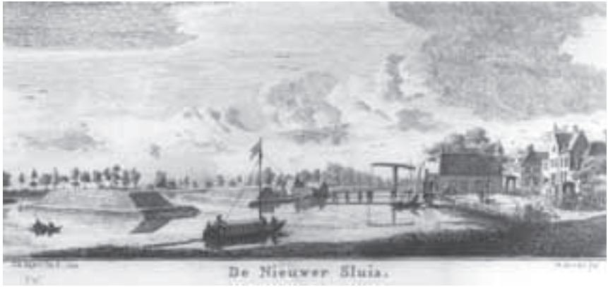
Afb. 7. Gezicht vanuit het noorden op Nieuwersluis door J. de Beyer uit 1749 (gegraveerd door W. Wriets, 12.5 x 26 cm, foto RAU cat. 922).