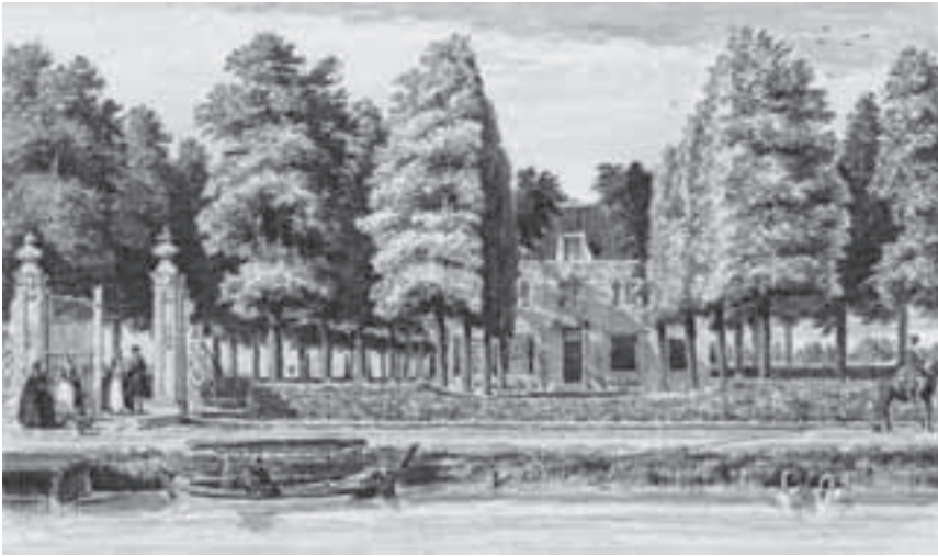
Afb. 5. Vecht en Schans alias Schans Sight met op de poort 'Vecht en Schans' door H.Spilman (aquarel 12.7 x 19.6 cm, Kon.Huisarchief MCS/808).