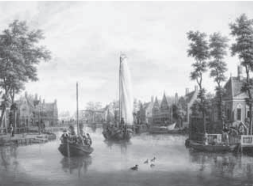
Afb. 9. Gezicht op Maarsse vanuit het noorden, ca. 1680, met links de trekschuit die door het paard met ruiter op het jaagpad in zuidelijke richting wordt getrokken, door Jacob Storck (olieverf op doek, ca 60 x 90 cm).

hout, gezien de brede hekaanslag, met op de pilaren de naam in zwart geschilderd (Afb.5). Nieuwersluis lag aan de overkant nu zonder wal zoals Afb.6 laat zien. Op Afb.7, die van 1749 dateert is te zien dat het fort of de schans in de tussentijd ten koste van Vecht en Schans aan de oostkant van de Vecht is uitgebreid. Het torentje van het kerkje is inmiddels gesneuveld en het gebouwtje is vrij drastisch verbouwd.