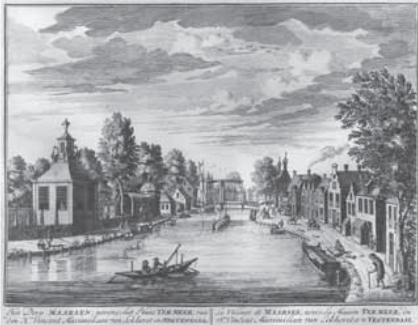
Afb. 11. Gezicht op Maarssen vanuit het zuiden, door D. Stoopendaal (ets-gravure nr.10, De Zegepraalende Vecht , 1719).

gedaante veranderd zijn is het waarschijnlijk dat het schilderij Maarssen vanuit het noorden weergeeft. Het hoge hek links staat dan vóór de voortuin van het huis Raadhoven en het classicistische speelhuis rechts, haast identiek met het eerder beschreven Nieuwersluisse exemplaar, moet voor kasteel Bolestein bestaan hebben. Later stond op die plaats een 18 de eeuwse theekepel, die begin 20 ste eeuw naar de tuin van het huis Beek en Hoff in Loenen (nu gemeentehuis) is verhuisd en daar nog staat. Overigens kan het heel goed zo zijn dat het hier gewoon om stoffage van het schilderij gaat, want op andere schilderijen door Jacob vanuit hetzelfde punt, daarvan bestaan er zeker nog vier of vijf, is van een kepel niets te zien.