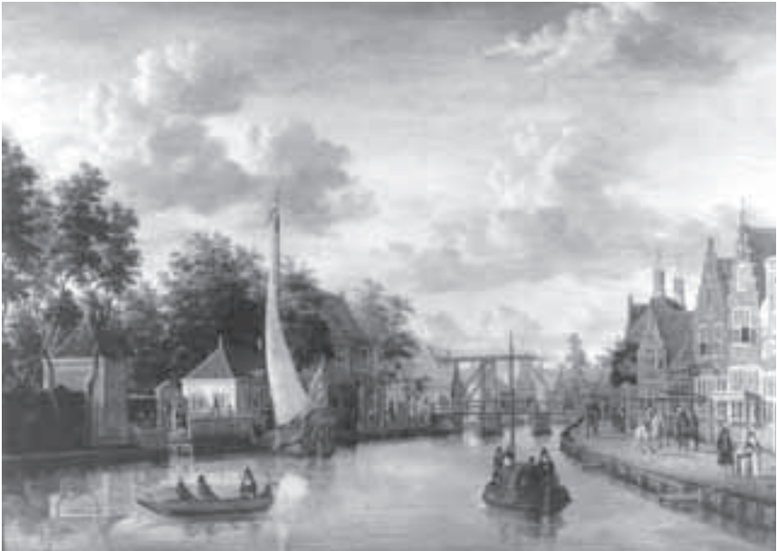
Afb. 12. Gezicht op Maarssen (zie afb.10), met links van de brug een stelling voor de inname van water zoals bij een brouwerij gebruikt werd, gesigeneerd 'Jacobus Stvrck' en gedateerd '1664' (olieverf op paneel, 46.5 x 63.2 cm. coll. Rijksmus. Twenthe, Enschede, bruikleen Oudh. Kamer Riessen,).

bouwtjes staan nu links op de oever en het hoge huis met de twee schoorstenen staat nu rechts bij de brug. Links ligt het park van Huis ter Meer en rechts loopt de Lange Gracht. De identificering wordt bevestigd door ets-gravure nummer 10 (Afb.11) uit De Zegepraalende Vecht . Ofschoon het laatste schilderij is gesigeneerd 'J. van der Heyden 1674' catalogiseerde Sotheby's het als van de hand van Jacob Storck (61.5 x 84 cm). Zij deden dit naar analogie van een schilderij, in de collectie van Rijksmuseum Twenthe en gesigeneerd door de laatste, dat vrijwel gelijk is aan het onderhavige doek, behalve een extra huis rechts en een spiegeljacht in plaats van de boeier, en dat 1664 gedateerd is (Afb.12). 9