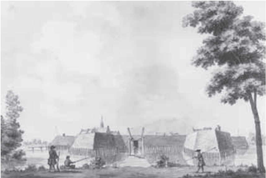
Afb. 2. De schans of fort Nieuwersluis vanuit het noorden in 1673. Het torentje is van het vroegere kerkje (grijsgewassen tekening, ca 1730, 19 x 26.5 cm foto RAU, cat. 2115).

dere eindpunt van het hoofdtraject bij de Weerdsluis te Utrecht. Mogelijk heeft Storck ook plaatsen verder naar het zuiden geschilderd, maar die zijn evenmin getraceerd. Er blijft dus nog werk van Jacob Storck te zoeken en vervolgens te duiden. Van een aantal schilderijen zijn copiën gevonden, die van een andere hand zijn. O.a. Johannes de Blauw schilderde in zijn trant en signeerde met eigen naam. 5