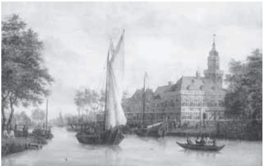
Afb. 8. Kasteel Nijenrode te Breukelen vanuit het noorden, ca 1670, links het Zand- en jaagpad aan de oostkant van de Vecht met jaagpaard en trekschuit, door Jacob Storck. De ligging van de gebouwdelen is gemanipuleerd. (olieverf op doek, ca. 60 x 90 cm,). Van dit schilderij is nog een versie bekend en er is er nog een vanuit het zuiden, gedateerd 1676, waarop de molen te zien is, die aan de Vecht stond op het punt waar de Straatweg van de Vecht afbuigt ten noorden van Nijenrode (81.3 x 112.4 cm veil. Phillips London 15-12-1998).