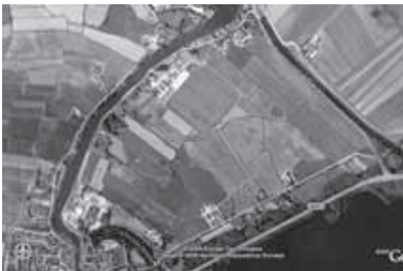
Afb. 1: Luchtfoto polder Dorssewaard bij Vreeland. 2

zandlandschap (overgang naar het Gooi met afzettingen uit de laatste twee ijstijden), het rivierenlandschap en de droogmakerij of polder – het gecultiveerde landschap.