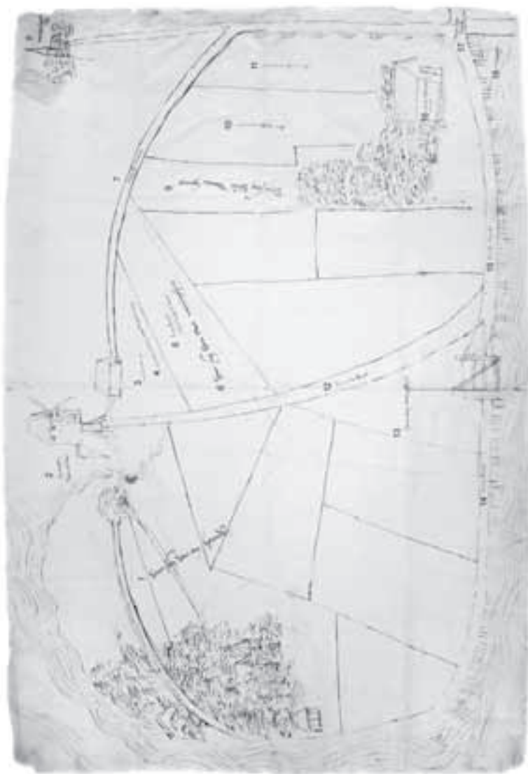
Afb. 7. Kaart van enige percelen land gelegen aan de Vecht onder Vreeland. Pentekening zonder naam. Ca. 1500, (HUA nr. 221 inv.nr. 1116) 1 blad.