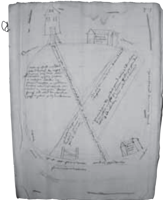
Afb. 5. Kaartje van de Dorssewaard ten behoeve van een geschil tussen het domkapittel en de kerkmeesters van Breukelen uit 1505-'12 over drie morgen land (HUA 216 nr.1159).

[voor de regels 1-6 staat:] aen die west sijde van de nywen dijck