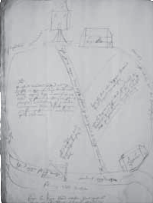
Afb. 6. (Zie ook afb.5) Kaartje van de Dorssewaard. Aan de onderzijde de in 1438 afgesneden Vechtbocht; links de Vecht en de Bergseweg; rechts de Kleizuwe; bovenaan de Gabriëlweg met halverwege een reeds lang verdwenen poldermolen (HUA 216 nr. 1159).

(r.15) [onleesbaar] van den nywen dijck 33,5 ende 30 roey facit 5,5 mergen 80 roey