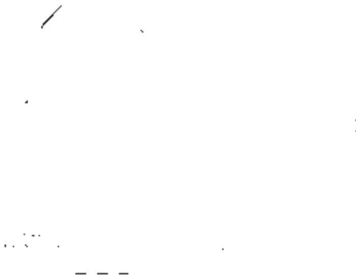
Afb. 3. Het park Welgelegen in de Dorssewaard (kadasterkaart 1832).

– maar vooral het landgoed in de polder Dorssewaard van de buitenplaats ‘Welgelegen’ is voor de geschiedenis van de polder Dorssewaard van belang.