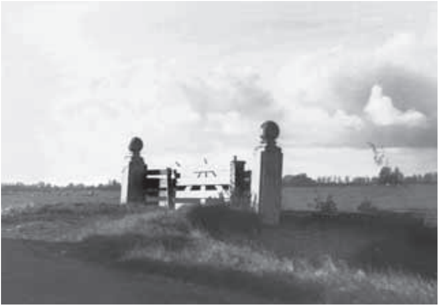
Afb. 2. Inmiddels verdwenen toegangspartij aan de Kleizuwe van park Welgelegen in de polder Dorssewaard.