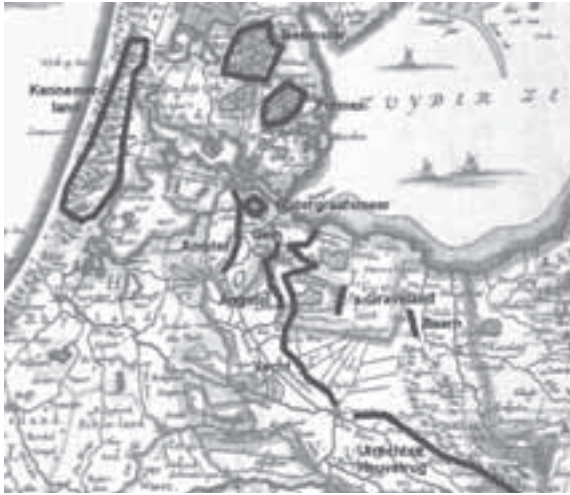
Afb. 1. Concentraties van buitenplaatsen in de 18 de eeuw.

voor permanente bewoning bedoeld!) maar waren tevens een statussymbool én een mooie gelegenheid om te netwerken met andere buitenplaatsbezitters.