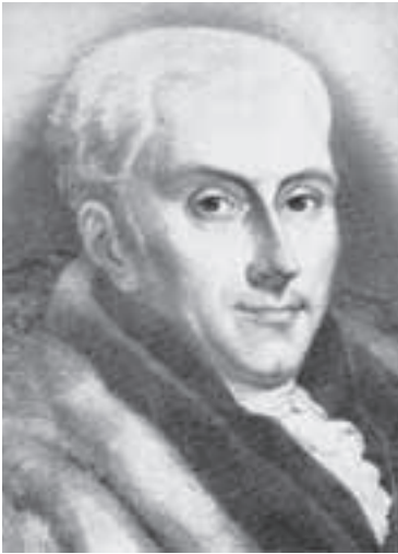
Afb. 2. Karel Gijsbert van Hogendorp.

Van Hogendorp rondt het verschil van f 1200 wijselijk naar boven af op f 1500, en zo is het buiten niet alleen een 'dood Capitaal', maar kost het ook nog de lieve som van anderhalf duizend gulden per jaar en een veelvoud aan frustraties.