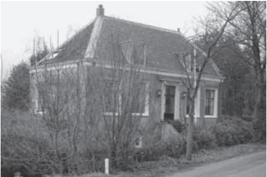
Afb.6. Middelvaart in 2005 met trap aan de straatgevel.