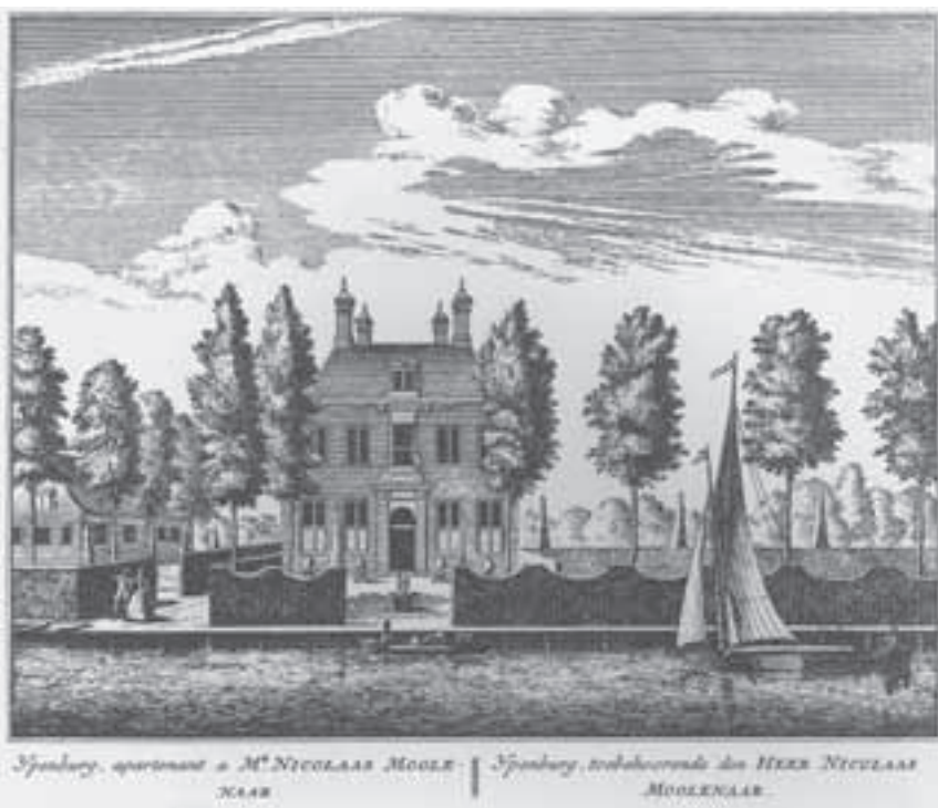
Afb.2. Ypenburg, Abcoude, rond 1730 door A. Rademaker ( Hollands Arcadia nr. 73).

roeden so wey- als hooylant, gelegen tussen Baembrugh ende Abcoude, omtrent 't Slot, van outs genaempt Het Hoge Landt, strekkende voor van 't Geyn tot aen de gemene Wagenwegh tusschen Utrecht en Amsterdam, belent suytwaerts de Heer van Naerden (de eigenaar van Ipenburg). 8