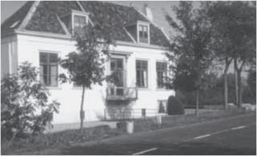
Afb.5. Middelvaart in 1960 zonder trap aan de straatgevel.