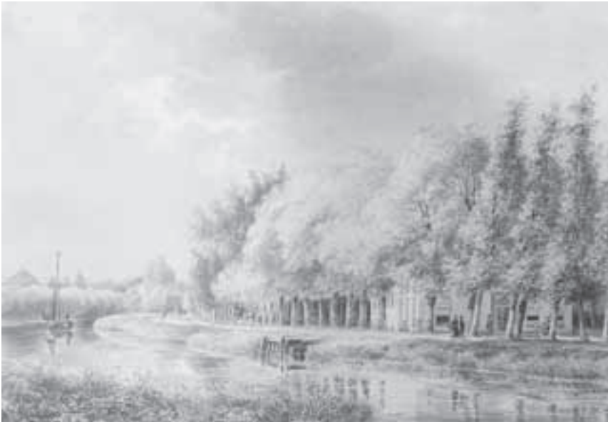
Afb.4. Middelvaart, Baambrugge, in 1843, door P.J.Lutgers ( Gezigten aan de Rivier de Vecht 2001).