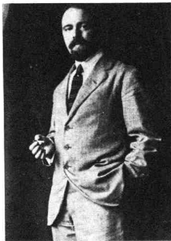
Prof. dr. P. Geyl (1887-1966) in de jaren dertig. Hij was hoogleraar in de vaderlandse- en algemene geschiedenis na de Middeleeuwen aan de Rijksuniversiteit te Utrecht van 1936 tot en met 1958.