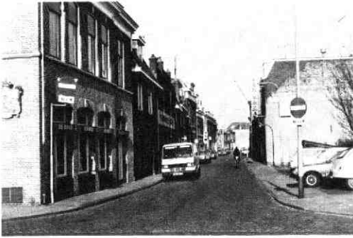
De Lauwerecht, het gedeelte waar de pijpenmakers woonden.

zijn beroep op prachtige wijze weergegeven met „toubacqspymaecker“.