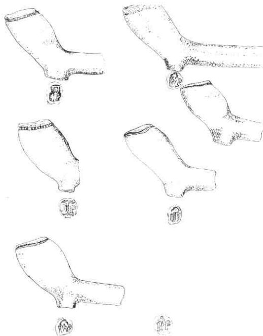
Zes maal het hielmerk IP