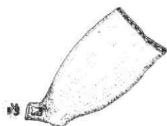
Pijpekop van de maker Joseph Peeks met het Goudse wapen en de letter S.