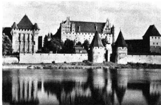
Het kasteel van de Duitse Orde te Mariënborg (thans Malbork) aan de rivier de Nogat in Pruisen (thans Polen). In dit kasteel zetelde de grootmeester van de orde.

Pruisen kwam succesievelijk geheel onder bestuur van de Duitse orde te staan. Hetzelfde gebeurde met Koerland en Lijffland. Tot aan 1945 zijn deze gebieden (evenwel met onderbrekingen) Duits gebleven.