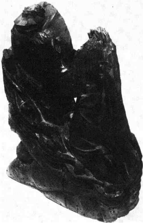
Sleutelstuk „Christus in Gethsemané.“